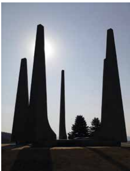
Památník Ploština.

sedou lidové strany mons. Janem Šrámkem, jehož v londýnském exilu prezident Beneš pověřil funkcí předsedy exilové vlády. Protože gestapo mělo podezření, že Prečan s ním udržuje ilegální styky, internovalo jej na Sv. Kopečku u Olomouce a omezilo na minimum jeho kontakty s duchovenstvem a s veřejností.