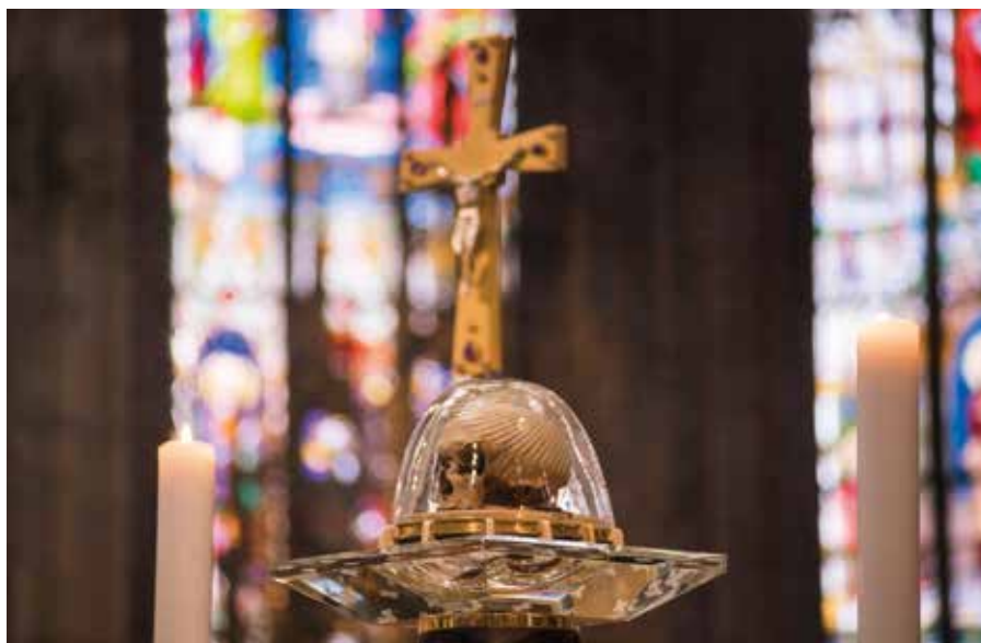
Lebka sv. Vojtěcha v pražské katedrále.

A proto se její údy o sebe navzájem starají; trpí-li jeden úd, trpí s ním všechny, a dostává-li se jednomu údu slávy, všechny se s ním radují. Slyší totiž a zachovávají ona slova: Nové přikázání vám dávám: Milujte se navzájem. Milujte se navzájem ne jako ti, kdo šíří zlobu, ani jako se milují lidé, protože jsou lidé, ale abyste se navzájem milovali jako ti, kdo se milují, protože jsou všichni bohové a synové Nejvyššího, takže jsou bratry jeho jediného Syna; abyste se navzájem milovali takovou láskou, jakou je miloval on, když je chtěl přivést k cíli, kde se naplní jejich touha, kde se nasytí dobrem veškerá jejich touha. Neboť tehdy, až Bůh bude „všechno ve všem,“ všechny touhy pomínou.