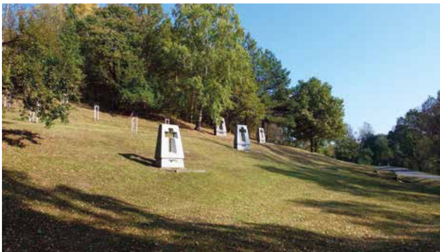
Památník Ležáky.

Postih neminul ani olomouckého arcibiskupa Leopolda Prečana. Ten byl před válkou v úzkém kontaktu s před-