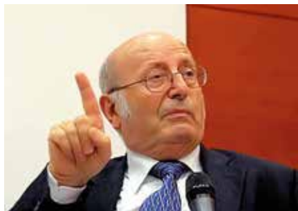
Prof. Giovanni Reale

F: Tak se to sice může jevit, avšak stále trvám na tom, že znovuoživení antiky by mohlo být výraznou vzpruhou pro umírající západní společenský organismus. Jsem si jasně vědom dnes převládajícího historismu, který odmítá připustit, aby se z antiky učinil inspirační zdroj při obno-