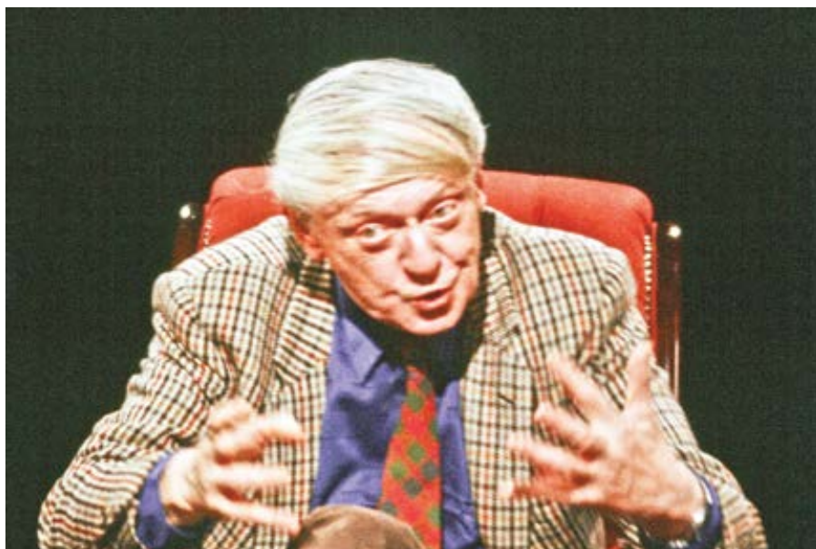
Anthony Burgess.

Skutečnost, že byl katolíkem vyrůstajícím v protestantském prostředí a že byl víc Ir než Angličan, způsobila, že se cítil, jakoby nepatřil nikam. Tento pocit jej pronásledoval až do konce života. Ač se v dospělosti pokládal za „katolíka odrodilce“, neztratil nikdy ke katolicismu úctu a vždy trval na tom, že Církev nabízí pravou víru. Byl to právě katolicismus, který Burgessovi nabídl potřebnou perspektivu, aby mohl psát o lidských obtížích v univerzálních termínech. „Neboť katolicismus je, i když se to zdá být paradox-