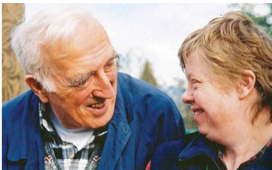
Jean Vanier.

Vanierův příběh a příběh založení L'Arche jsou legendární, jsou to však pravdivé a velmi dobře dosvědčené legendy. Jean Vanier se narodil roku 1928 v Ženevě ve vážené kanadské rodině. Jeho otec byl kanadským vyslancem ve Francii, když Němci překročili Maginotovu linii a postupovali směrem na Paříž. Rodina uprchla do Británie a poté do Kanady. Ale ve věku 13 let se Vanier do Británie