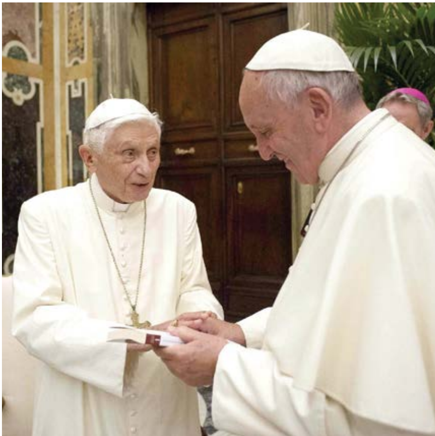
Emeritní papež Benedikt XVI. a papež František.

Velkou pozornost věnoval papež tématu Evropské unie. V odpovědi na dotaz německého novináře František upozornil na potřeby změn v Evropské unii.