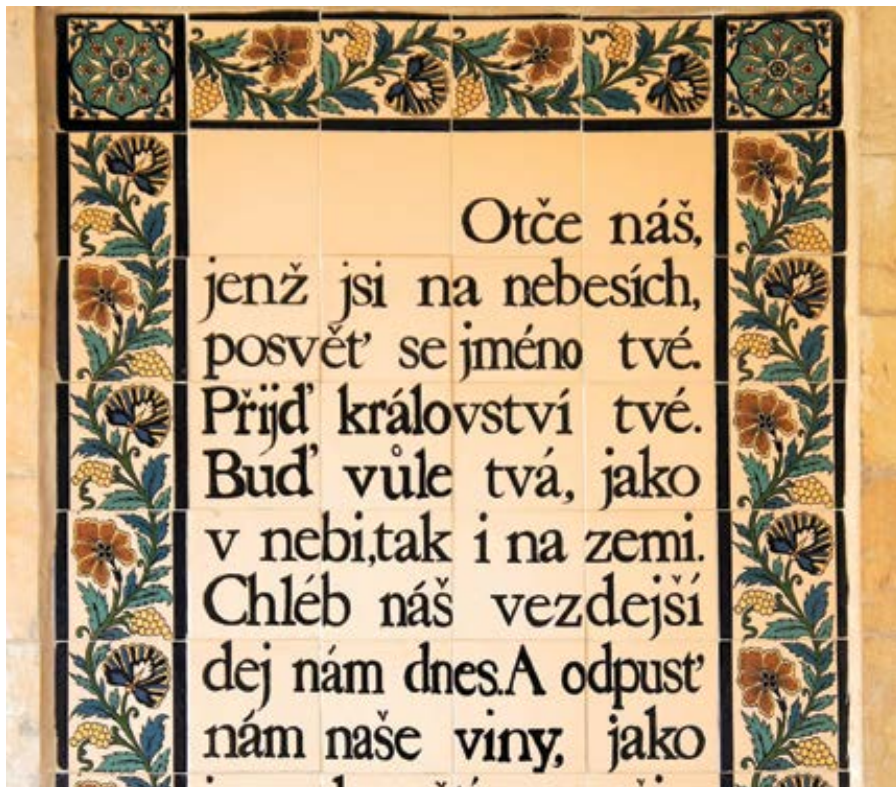
Modlitba Otče Náš v češtině, kostel Pater noster v Jeruzalémě.

Nedávno skončily volby do Evropského parlamentu. I když se ukázaly některé trendy do budoucnosti, o ničem zásadním nerozhodly. Budeme se dál angažovat ve prospěch života a pravdy. To je úkolem křesťanského společenstva v průběhu celých dějin. Ne vždycky můžeme prosadit náš pohled na to, jak by měla žít naše společnost. Budeme muset žít uprostřed rozmanitých kompromisů. Přece je dobré vědět, že není kompromis jako kompromis. Je rozumný kompromis a je i míň rozumný kompromis. Nám má jít o to, abychom tam, kde je to možné, dělali jako křesťané rozumné kompromisy, a tam, kde to není možné, se těmto kompromisům vyhýbali nebo je jednoznačně odmítali.