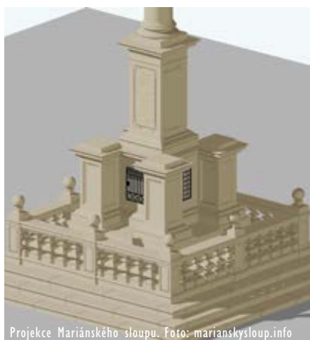
Projekce Mariánského sloupu.