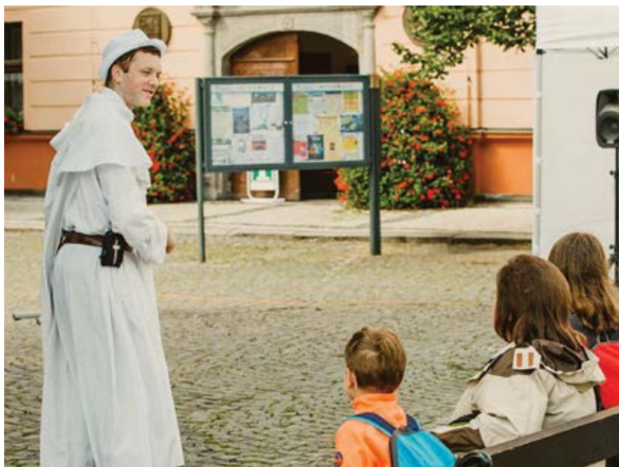
Dominikánská misie.