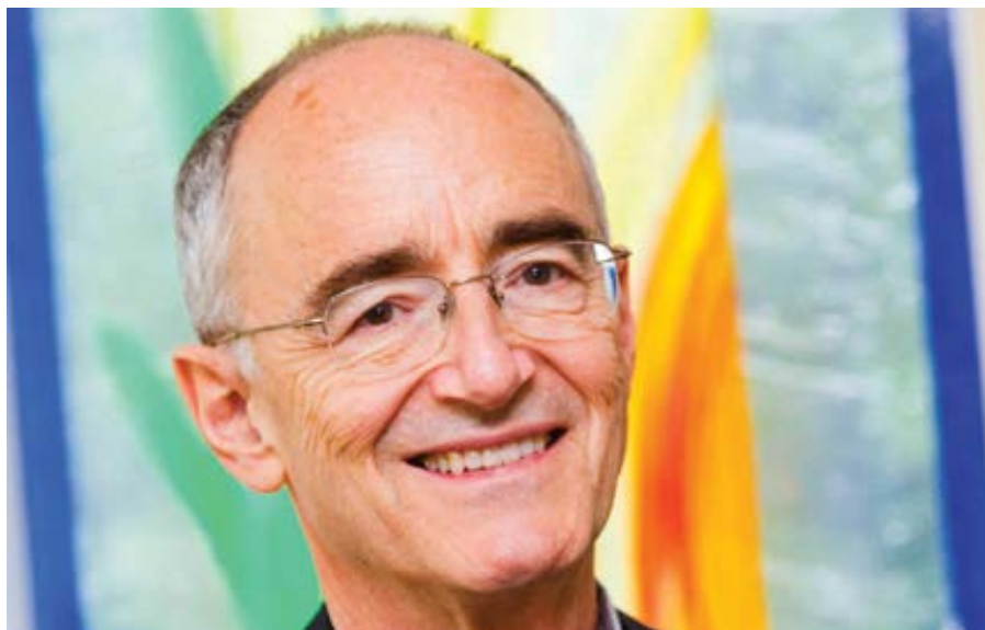
Fr. Michael Czerny.

Během polední promluvy před mariánskou modlitbou Anděl Páně v neděli 1. září 2019 oznámil papež František jmenování 13 nových kardinálů. Jeden z nich, jezuita P. Michael Czerny, je dokonce rodákem z bývalého Československa, pochází z Brna.