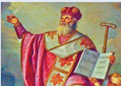
Sv. Atanáš.