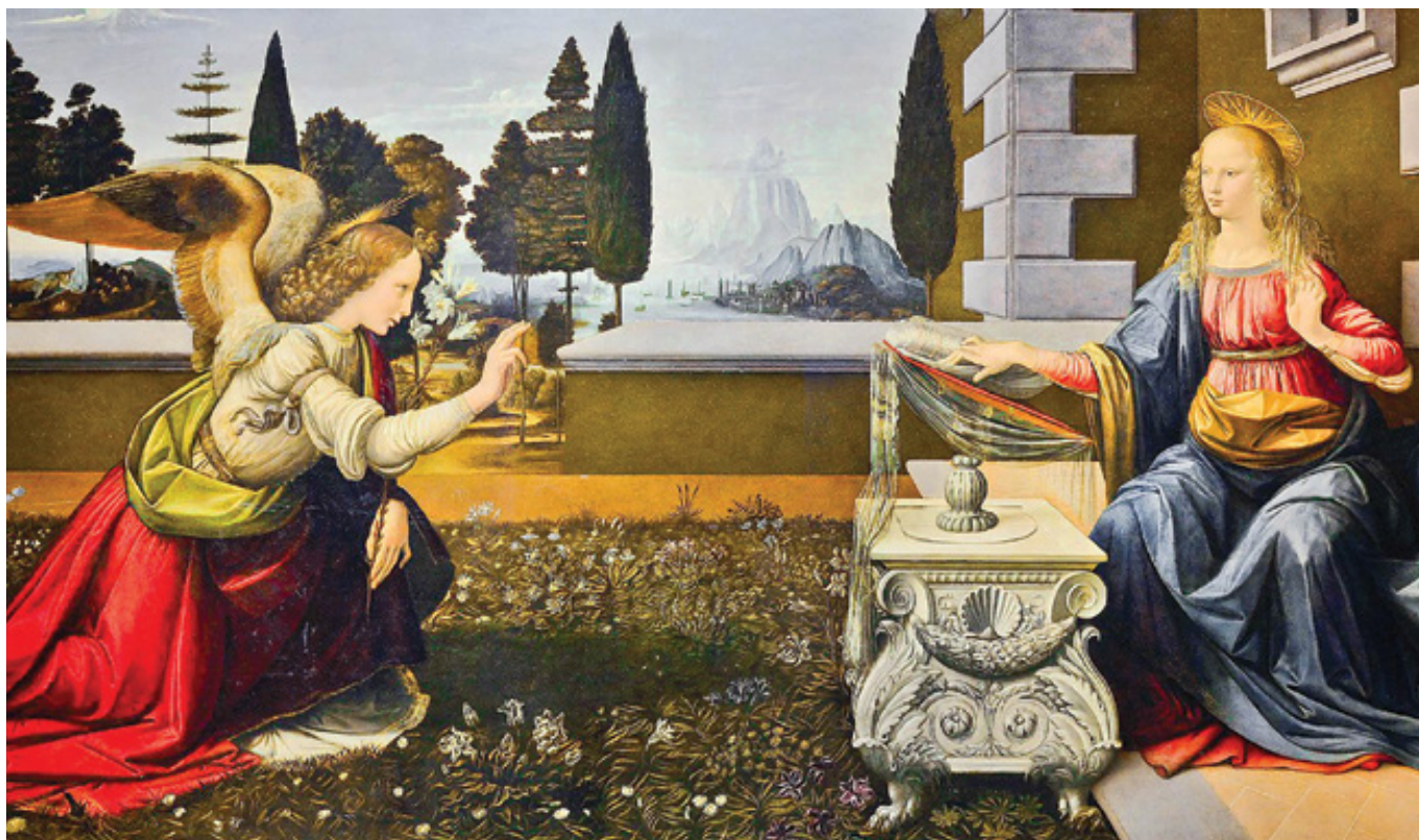
Leonardo da Vinci: Zvěstování (1472)