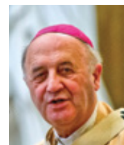
Mons. Jan Graubner arcibiskup olomoucký a metropolita moravský

K obrácení, které přispěje k oživení církve, každému z Vás ze srdce žehná