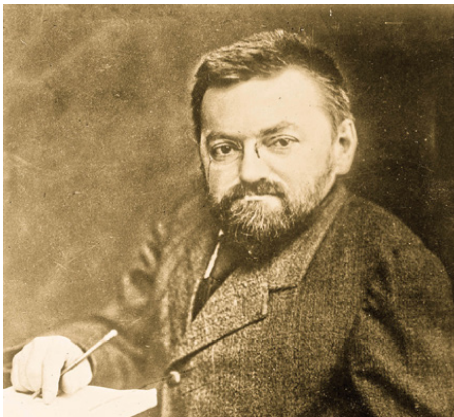
Karl Steinmetz.

Do roku 1892, ani ne o tři roky později, byl Steinmetz známý nejen v Americe jako vědec světového formátu. Vypracoval zákon hystereze, s jehož pomocí se dá vypočítat množství energie, která se ztratí v elektrickém zařízení během změny magnetické aktivity na nevyužitelné teplo. Ap-