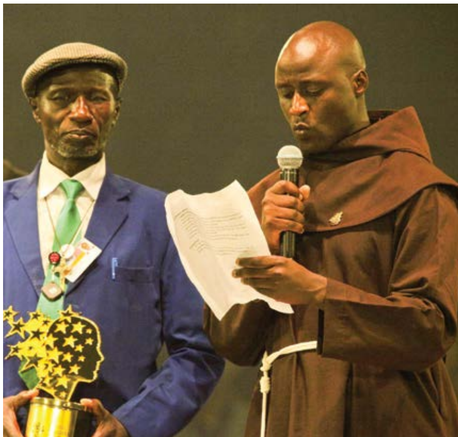
Františkán Peter Tabichi.

Šestatřicetiletý kněz Peter Tabichi se stal letošním laureátem ceny Global Teacher Prize. Keňský františkán, učitel matematiky a fyziky na Keriko Secondary School v polopouštní oblasti Rift Valley zvítězil mezi padesáti finalisty vybranými mezi čtyřiceti tisíci kandidáty z celého světa. Cena udělovaná Varkey Foundation pod záštitou premiéra Spojených arabských emirátů, šejka Mohammeda Bin Rashida Al Maktouma, obnáší milion dolarů, které františkánský kněz věnuje na rozvoj školství ve své oblasti.