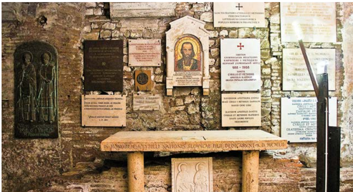
Bazilika sv. Klimenta v Římě – hrob sv. Cyrila.

V bazilice sv. Klimenta nedaleko Kolosea byl v roce 869 pochován sv. Cyril. 1150. výročí jeho smrti přivedlo do Říma nejvyšší představitele českého a slovenského parlamentu. Ve čtvrtek 21. března se zúčastnili slavnostní mše v bazilice nad jeho hrobem a následující den je na zvláštní audienci přijal papež František.