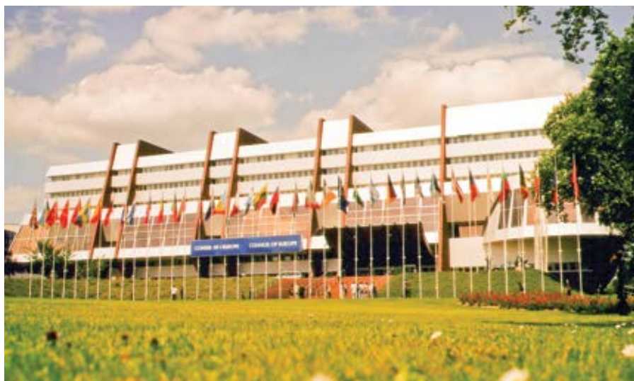
Sídlo Rady Evropy ve Štrasburku.

Původním záměrem Rady, za jejíhož ideového otce bývá považován Winston Churchill, byla poválečná evropská integrace. Abychom však nazývali věci pravými jmény: šlo o projekt, který z větší části zkrachoval, protože tuto funkci na sebe strhla vznikající tzv. evropská společenství: v roce 1951 to bylo Evropské společenství uhlí a oceli (ESUO, tzv. „montánní unie“), v roce 1957 Evropské hospodářské společenství (EHS) a téhož roku Evropské společenství pro