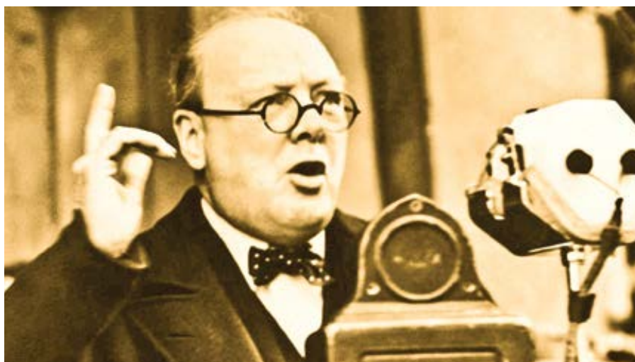
Winston Churchill.

Kdo byl vlastně Churchill? Odkud pramenilo jeho výjimečné odhodlání, které bylo tak viditelné a které přineslo takové