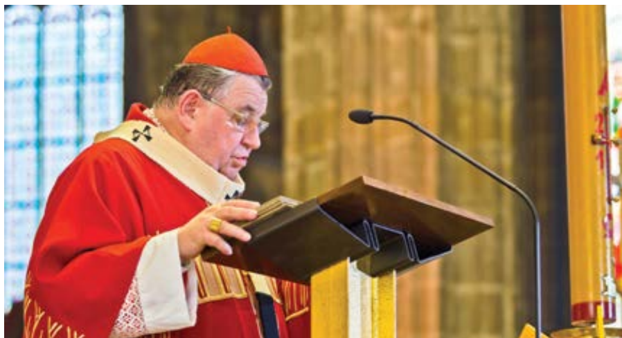
Kardinál Dominik Duka při repatriaci kardinála Josefa Berana.

nejlepší, když každý stojí sám a bez jakéhokoli zázemí – s takovým člověkem se nejlépe manipuluje! Blíží se snad doba, kdy se pokusy z hrůzného sci-fi dramatu Hoši z Brazílie stávají realitou?