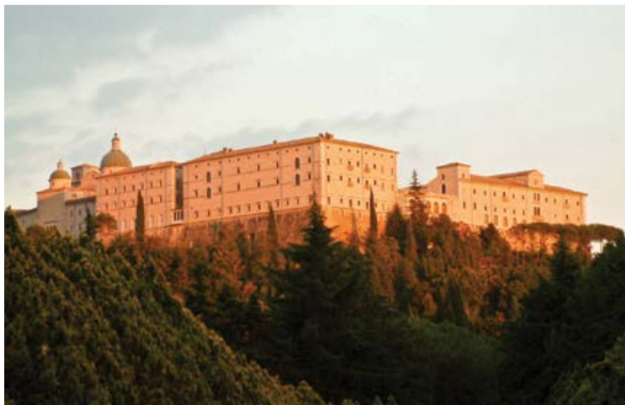
Opatství Monte Cassino.

Následovala studia v Paříži a Kolíně nad Rýnem. V těchto střediscích intelektuálního života se Akvinský připojil k dalším mladým dominikánům pod vedením Alberta Velikého, raného domini-