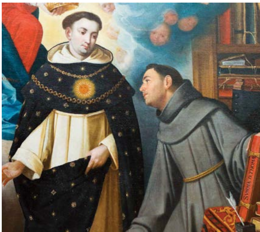
Vlevo sv. Tomáš, vpravo sv. Vavřinec.

Akvinský se narodil a své mládí strávil v Sicilském království. Bylo to v době, kdy se Fridrich II. Štaufský (1194–1250) a papež Řehoř IX. (cca 1148–1241) nacházeli ve válečném stavu. V roce 1239, když bylo Akvinskému čtrnáct, papež Fridricha exkomunikoval, a ten následně zahájil invazi do papežských států jako součást dlouho odkládané ofenzivy proti Lombardským komunám. Tento významný střet mezi občanskou a církevní autoritou byl pouze prvním z mnoha konfliktů, které dominovaly