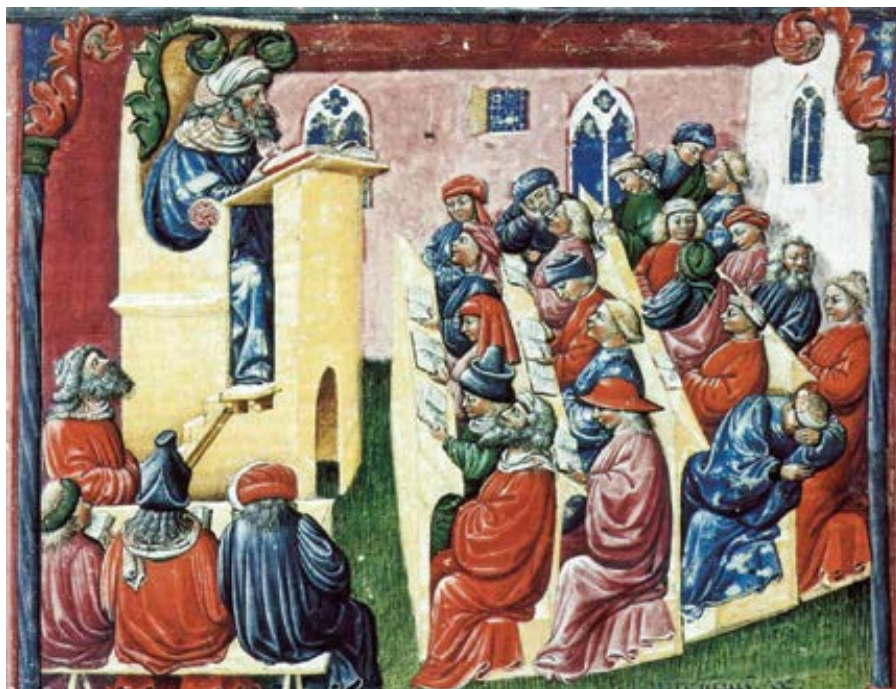
Přednáška na Boloňské univerzitě ve druhé polovině 14. století. Laurentius de Voltolina, 2. polovina 14. století

Učení Tomáše Akvinského uplatňovalo svůj vliv na převážně, nikoli však výlučně, Západní intelektuální hnutí po