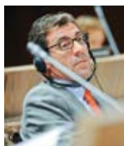
Luca Volontè italský politik