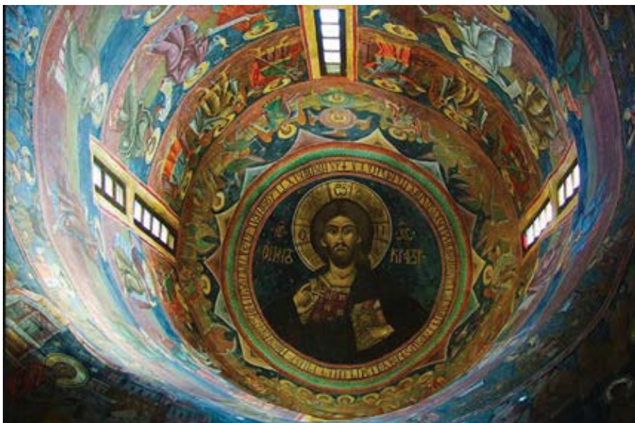
Kristus Pantokrator. Kupole chrámu kláštera Polovragi v Rumunsku.

Jak již bylo řečeno, je pravda, že v západním křesťanství je problém. Ten však nepochází z Gn 1,28, ale z augustinianismu, který naznačuje, že svět je odsouzen k zániku. Jestli je tedy podle kazatelů osud světa takový, zničte ho hned! To nevypadá jako příliš lákavá vyhlídka. Dokud se neoprostíme od augustinianismu, křesťanská ekologická spiritualita bude od nekřesťanů „přebírat“ myšlenky o spáse světa („zachránit planetu“) nebo usmíření („usmířit se s přírodou“)! Vypadá to, jako by křesťané zapomněli na křesťanské ideje a převzali je od nich ostatní! To je přesně to, co nazývám „bodem zlomu svatého Augustina“ a co jsem vyložila ve své knize Kristův slavný příchod: Pravá naděje pro svět .