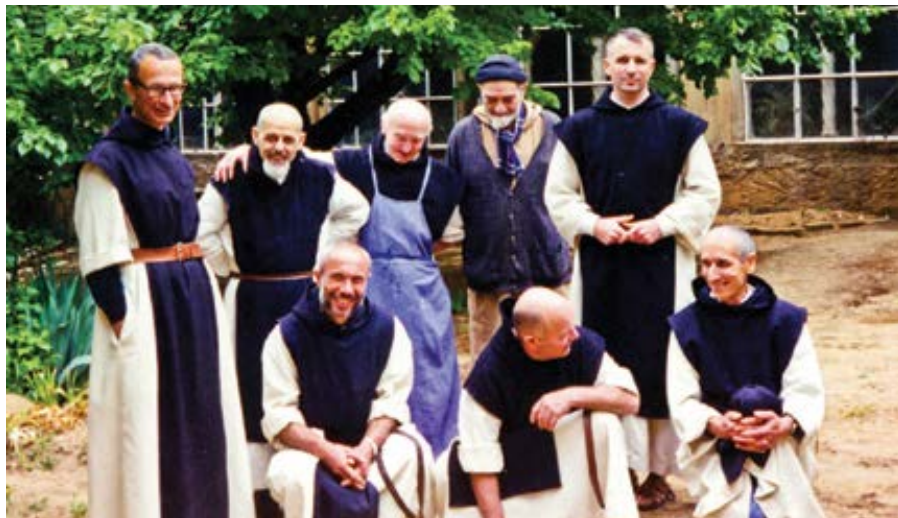
Zavraždění trapističtí mniši z Tibhirine.

a možná i Severní Korea. Očekává se, že mezi bezpečnější přístavy budou v roce 2020 patřit Kypr a Černá Hora. Existuje však jedna země, kterou pravděpodobně nenavštíví: svou vlast, Argentinu, do níž se nevrátil od svého zvolení v roce 2013.