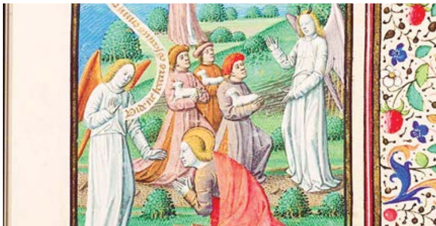
Rozdíl mezi dobrými a špatnými anděly.