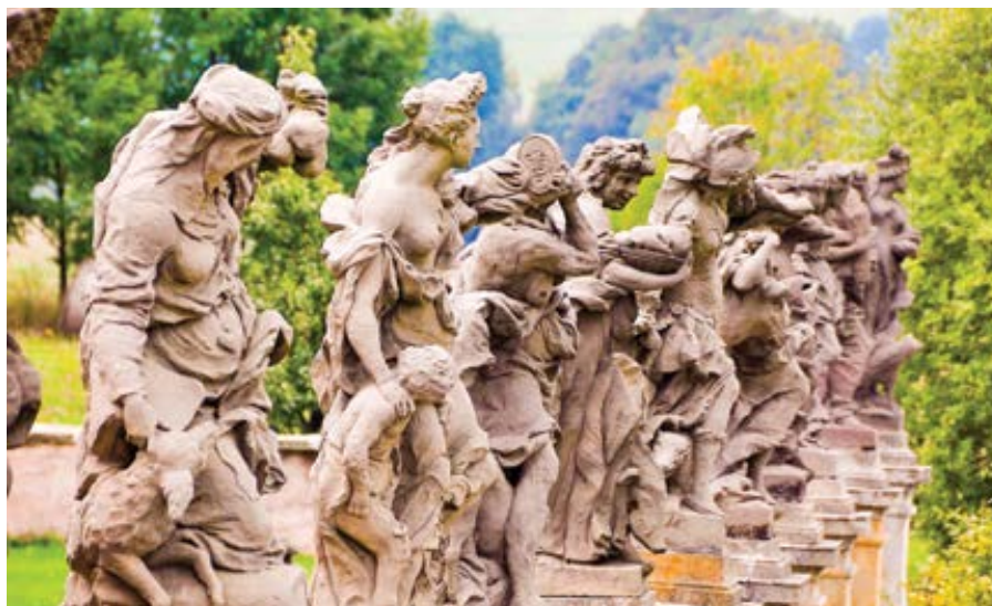
Ctnosti a neřesti.