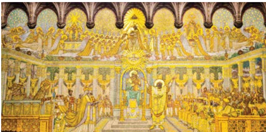
Efezský koncil roku 431 zobrazený v lyonském kostele Notre-Dame de Fourvières.

sah Ježíšova učení skutků pochopili až po setkání se zmrtvýchvstalým Kristem a se slání Ducha svatého. Tyto události byly pro první buňku církve, tj. jeruzalémské společenství, zlomem v chápání celé Ježíšovy osoby. Všechno to, co s ním prožili, co od něj slyšeli a co na vlastní oči viděli (srv. 1 Jan 1, 1nn) přestalo být záhadou a začalo v jejich myslích a srdcích do sebe zapadat. Změna vystrašených učedníků schovaných za zamčenými dveřmi ve společenství veřejně a radostně vyznávající Krista jen dosvědčuje hlubokou pravdu, kterou vystihl svatý Pavel krátkou větou: Nikdo nemůže říci: „Ježíš je Pán“, leč v Duchu svatém (1 Kor 12, 3). Letnice ovšem nebyly jednorázovým zážitkem, po kterém se Duch svatý „stáhl do ústraní“. Církev šla v tomto Duchu dál a s jeho pomocí začala brzy Ježíše chápat a hlásat ho i jiným. A bylo co vysvětlovat.