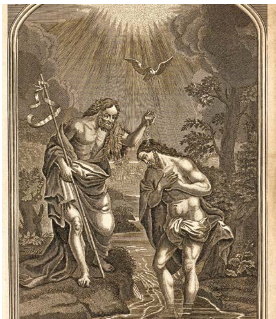
James Mynde: Jan křtí Krista (1737)

Jan křtí, Kristus přistupuje: snad i proto, aby posvětil toho, kdo křtí. Zcela jistě však proto, aby do vody pohřbil starého Adama, dříve než posvětil nás a pro nás Jordán: a jako sám byl duch a tělo, tak aby byl také zsvěcen skrze Ducha a vodu. Křtitel se zdráhá. Ježíš stojí na svém. Já bych měl být pokřtěn od