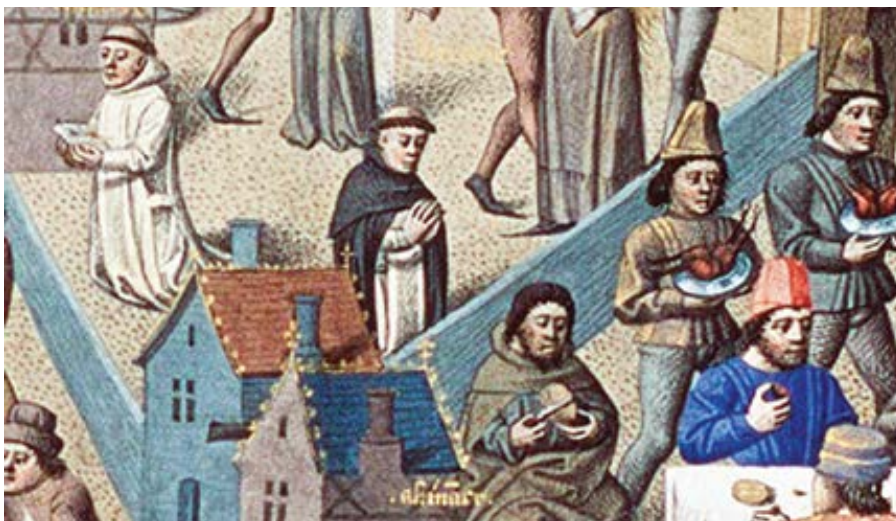
Přepych vs. cudnost.

o vlastních předsudcích reportérů spíše než vážným komentářem ke zprávě a faktům, o kterých pojednává.