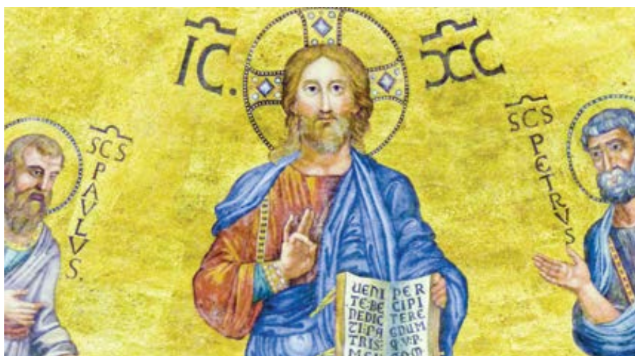
Ježíš Kristus na mozaice v bazilice sv. Pavla za hradbami v Římě.

Dogma je jasné a zřetelně formulovaná pravda víry. Je mnoho dogmat, ale víra jen jedna. Víra není slepenec útržko-