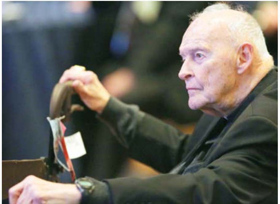
Theodore McCarrick.

Verdikt o vině Theodora McCarricka vynesla Kongregace pro nauku víry v samostatném, již uzavřeném řízení na základě kanonického práva. Neskončilo jen odstraněním McCarricka z veřejného života ani pouhým zbavením cti být kar-