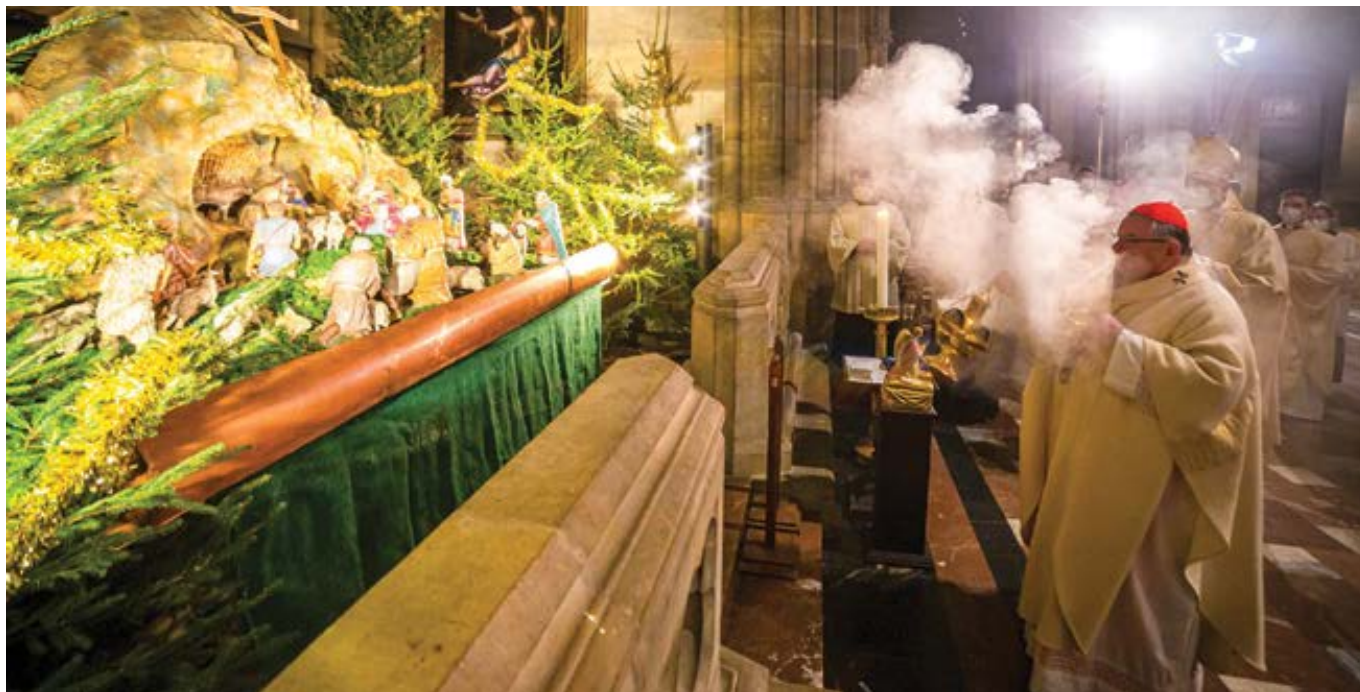
Dominik kardinál Duka OP.