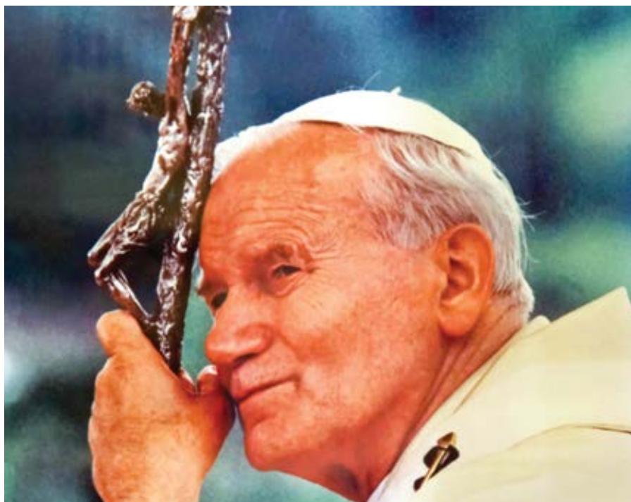
sv. Jan Pavel II.

Kanonizace papeže není zároveň kanonizací jeho pontifikátu. Kdyby tomu tak bylo, neexistovali by žádní svatí papežové kromě prvních přibližně 50 římských biskupů, kteří – jako většina ostatních světců prvních dvou století – zemřeli mučednickou smrtí. Od roku 1234, kdy byla kanonizace definitivně formalizována jako právní proces pod papežským dohledem, až do 20. století byli uznáni pouze tři papežové hodnými svatořečení.