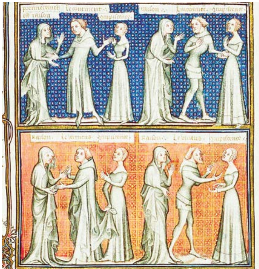
Cudnost naslouchá rozumu, nečistota naslouchá chtiči.

kou. Římské právo se však hned nesklo- nilo před křesťanským požadavkem více než jednoho svědka. Znamé rčení „jeden svědek, žádný svědek“ se začalo používat až po vydání tolerančního ediktu pro křesťany v roce 313.