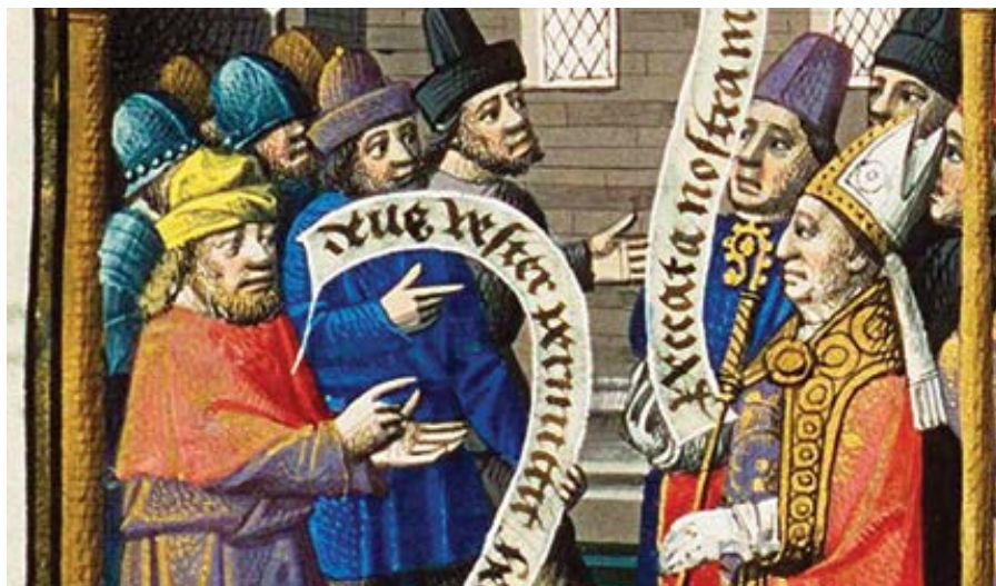
Sv. Augustin diskutuje o hříchu.

Dokument, který Theodora McCarricka přímo obviňuje z homosexuality, byl nakonec napsán v listopadu 2006 (více než rok po smrti Jana Pavla II.). Teprve tehdy se začaly vršit konkrétní důkazy. Odešel do důchodu (rozhodně ne předčasně) kvůli tomuto důkazu ze semináře Redemptoris Mater provozovaný Neokatechumenátní cestou v Hayttsville ve státě Maryland. Papež Benedikt XVI. věřil, že byla přijata disciplinární opatření, ale Theodore McCarrick nadále cestoval po světě. Během svých návštěv Věčného města vykonával své povinnosti kardinála v různých římských dikasteriích. Kongregace pro biskupy očekávala, že bude méně vystupovat na veřejnosti, ale on to rozhodně neměl v úmyslu a využíval určité beztrestnosti plynoucí z nedostatku přesvědčivých důkazů, které by měly za následek tresty stanovené kanonickým