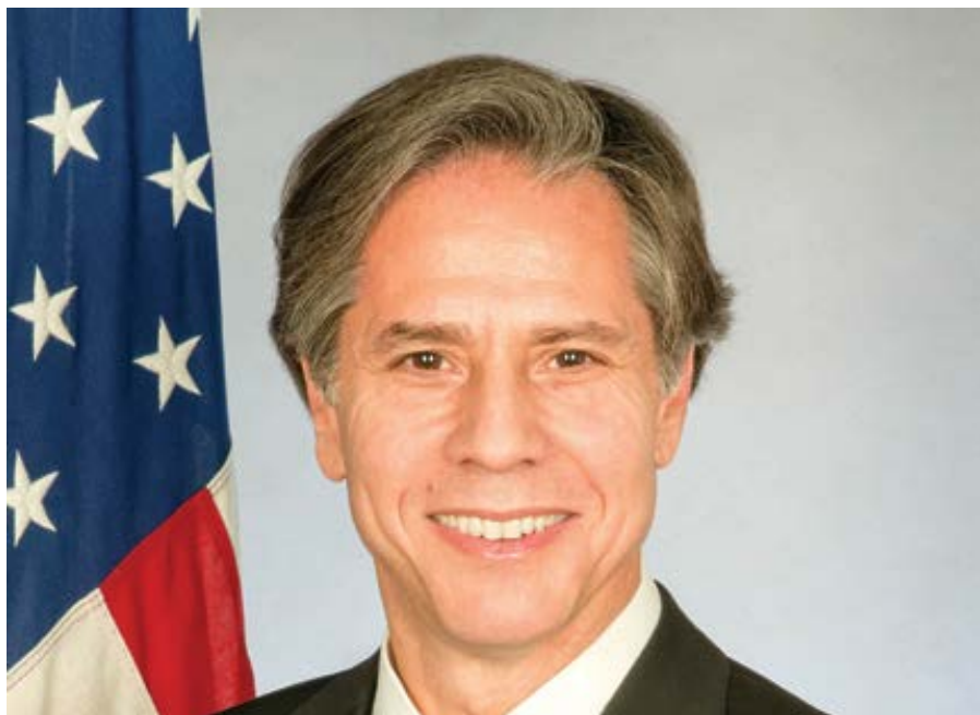
Anthony J. Blinken.

Skupiny podporující interrupce a LGBT tleskají tomu, že americký senát potvrdil jako nového ministra zahraničí Anthonyho Blinkena. Blinkena, jehož prezident Joe Biden jmenoval jako příštího ministra zahraničí, americký senát potvrdil do funkce v úterý 26. ledna poměrem hlasů 67:22. V letech 2015–2017 sloužil za prezidenta Obamu jako náměstek ministra zahraničí.