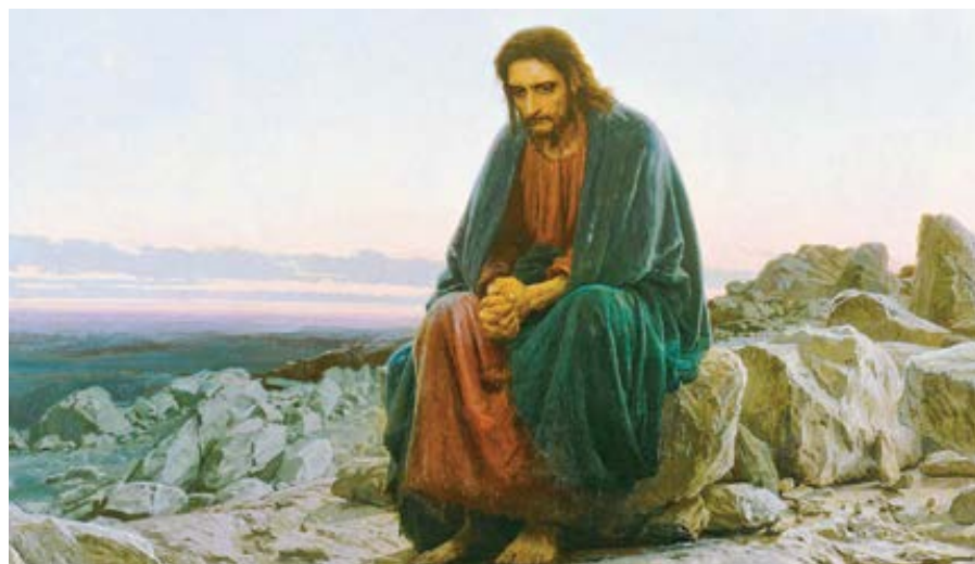
Ivan Nikolajevič Kramskoj: Kristus na poušti (1892)

Ustupuje stín a přichází pravda. Jan ve vězení, zákon v Judeji, Ježíš v Galilei a Pavel mezi pohany ohlašuje evangelium o Božím království. Po pozemském