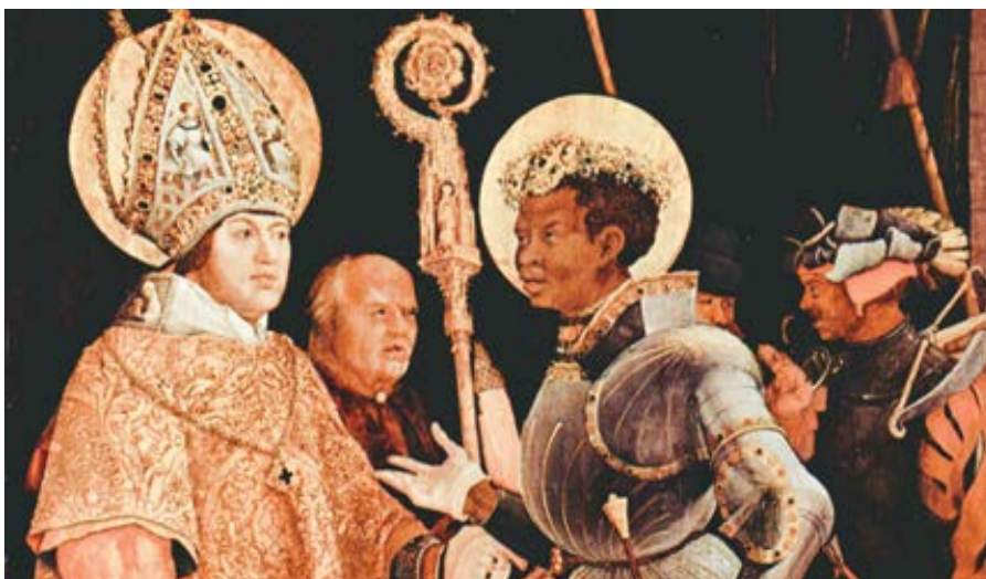
Matthias Grünewald: Svatý Erasmus a sv. Mořic (1520 až 1524)

Proto se moderní historikové mylí, když dělají tlustou čáru mezi údajně nevzdělaným a pověřčivým středověkem a světtáckou, učenou Evropou doby renesance. Byl to právě Machiavelli, zcela typický renesanční myslitel, kdo opovrhoval filozofii. „Je totiž velký rozdíl mezi tím, jaký