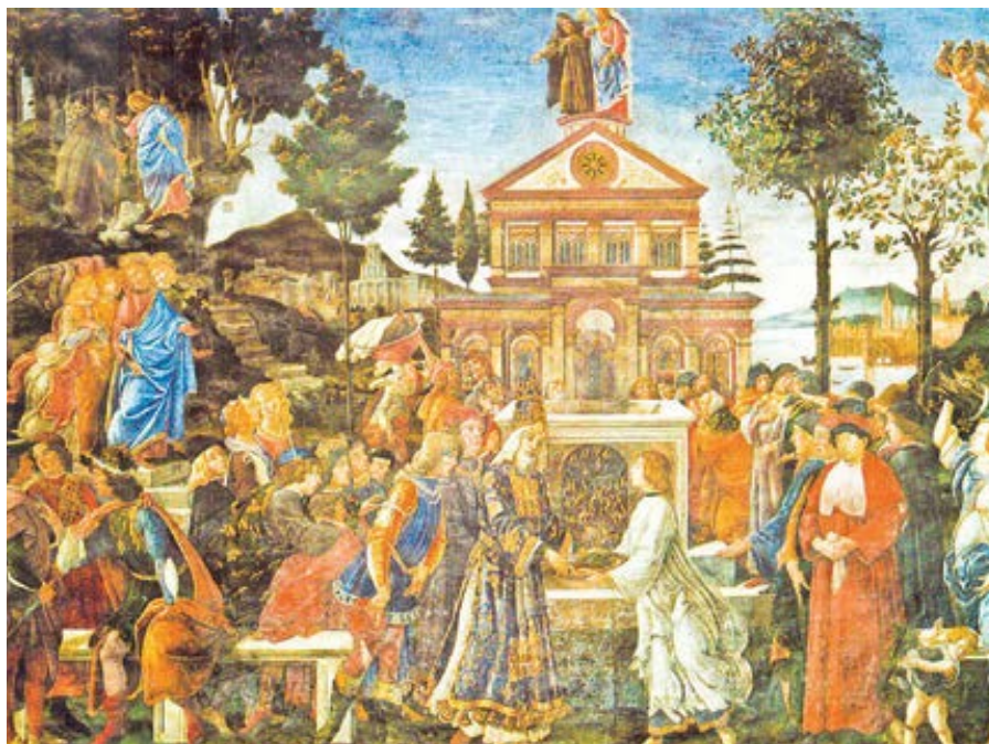
Sandro Botticelli: Pokušení Krista (mezi 1481 a 1482)

Stále ovšem zůstává otázka po opravdovosti pokušení. Pán tedy nemohl podlehnout. Musí to nutně znamenat, že byl pokoušen jen naoko? Řekli jsme si, že