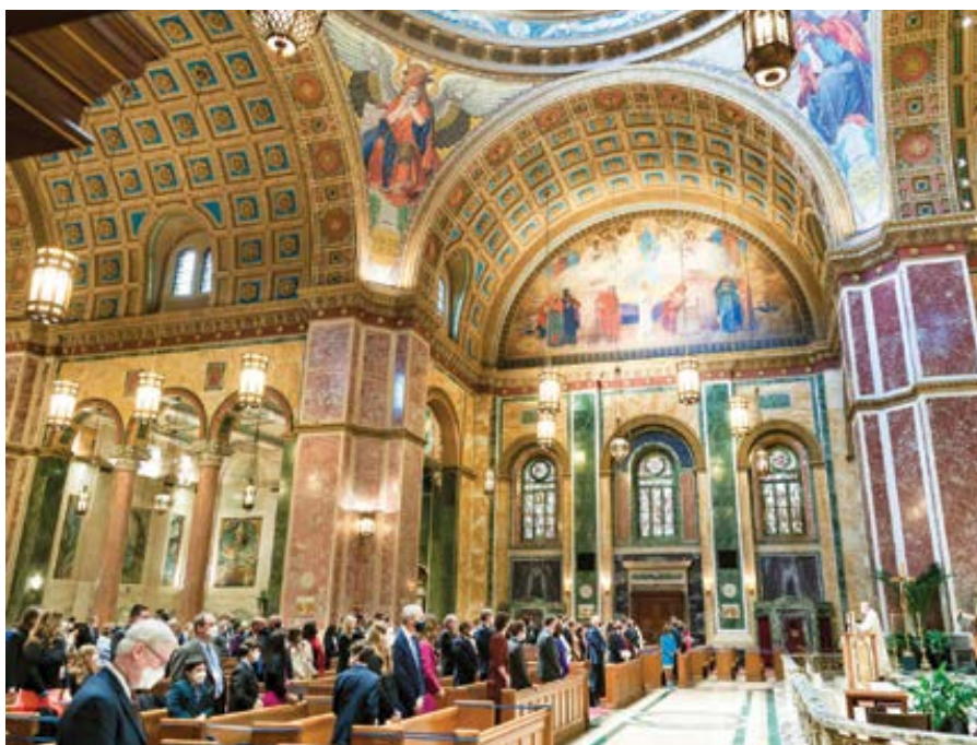
Joe Biden v katedále sv. Matouše ve Washingtonu 20. ledna 2021.

Jinými slovy, zdá se, že mluvčí současné vlády je připravena odvolávat se na prezidentovo katolické vyznání s cílem vyhnout se zkoumavým otázkám na