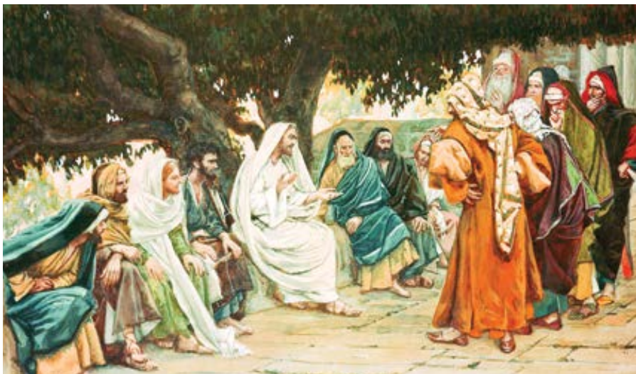
James Tissot (1836-1902): Farizeové a saduceové přicházejí pokoušet Ježíše

F: Možná dnes neodpovím na obě tvé otázky. Rád bych se tématu věnoval podrobněji a tak odbočím k výkladům, které se ti možná budou zdát zavádějící. Nakonec ale zapadnou do celkové mozaiky. Není vůbec důležité, jak velký počet lidí pracoval na projektu „Institutu pro sociální výzkum“ alias Frankfurtské školy. Rozhodující v této věci bylo, že měli finanční a politickou podporu německé a americké vlády. Byla to tedy silná státní moc, o níž se mohli opřít a o níž se také opírali. Kromě toho měli na své straně ještě jednu obrovskou výhodu. Většina členů Frankfurtské školy byla židovského původu. V 30. letech dvacátého století uprchli před nacisty do Spojených států, kde ve své činnosti pokračovali pod ochrannými křídly Columbia University. Po skončení války se někteří z nich vrátili do Německa a jejich aktivity byly posvěceny z těch nejvyšších míst. Studenti v těchto lidech spatřovali velkou morální autoritu, neboť šlo o zdatné myslitele, kteří se na rozdíl od velké části německých intelektuálů nezkomprotovali s nacismem. Navíc vypracovali teorii, která měla vysvětlit důvody vzniku masivního nacistického hnutí v kulturně vyspělé německé společnosti, a předložili strategii, jak se podobným katastrofám vyhnout v budoucnosti. Závěry jejich výzkumu byly pocítovány jako nezbytné i pro odčinění těžké německé viny. V neposlední řadě sehrála důležitou úlohu i jejich imunita před možnou kritikou ze strany těch, kteří s jejich analýzami