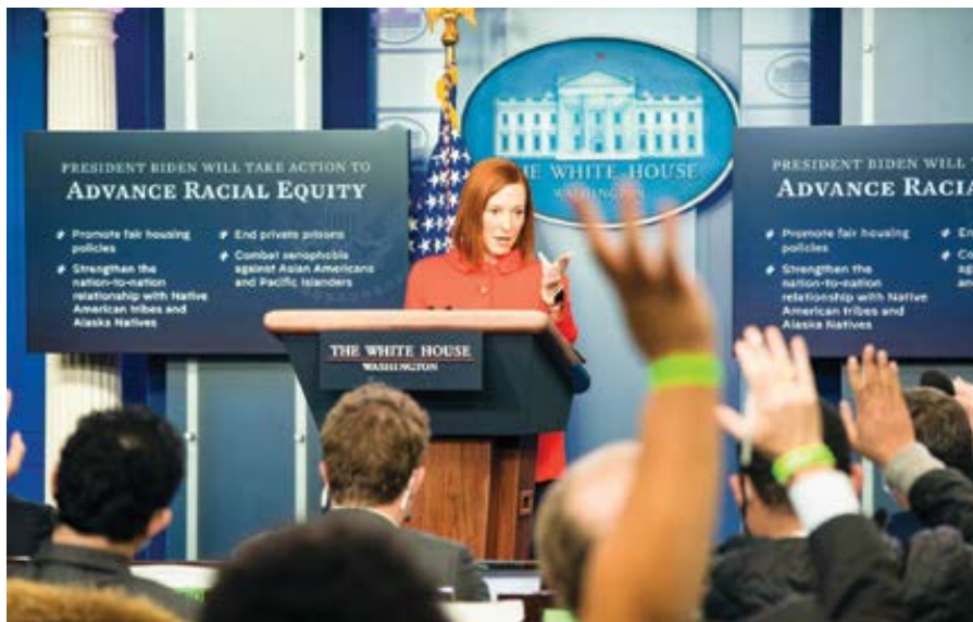
Jen Psakiová, tisková mluvčí Bílého domu.

Zdá se, že mluvčí současné vlády je připravena odvolávat se na prezidentovo katolické vyznání s cílem vyhnout se zkoumavým otázkám na jeho plánovaný politický postoj k státnímu financování potratů.