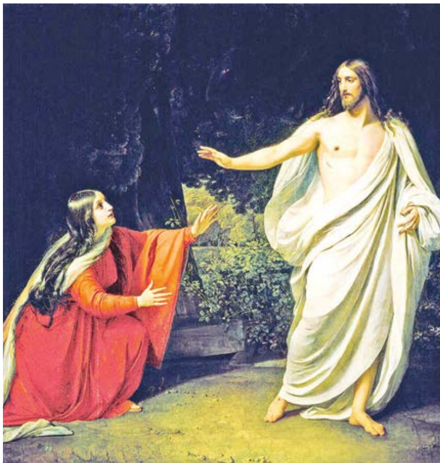
Alexandr Andrejevič Ivanov: Zjevení Ježíše Krista Marii Magdaléně (1835)

Nemůžeme si myslet, že takový podrobný evangelistův popis v sobě neobsahuje žádná tajemství. Mladší Jan nám spíše symbolizuje synagogu, starší Petr pak církev pohanů. Synagoga sice došla k praxi uctívání Boha dříve než Církev, ale svět začal užívat přítomnost zástupu pohanů než synagoga. Běželi zároveň, protože pohanství běželo společně se synagogou po té stejné, společné cestě, i když ne v totožném společném smyslu od začátku svého vzniku až po zánik. Synagoga přišla k hrobu první, ale nevstoupila v něj, protože sice přijala přikázání Zákona a vyposlechla proroctví o Pánově vtělení a utrpení, ale nechtěla jednoduše věřit v mrtvého. Přišel však Šimon Petr a do hrobu vstoupil. Církev pohanů, která šla za ní, jednak viděla, že Ježíš Kristus je v těle nyní mrtvý, ale současně uvěřila, že je živým Bohem. Rouška, kterou měl Pán na hlavě, nebyla mezi dalšími