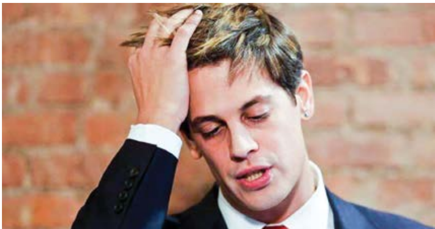
Milo Yiannopoulos.

Milo: Když jsem dřív vtipkoval, že jsem se stal homosexuálem jen proto, abych mučil svou matku, nebylo to tak úplně z legrace. Samozřejmě mi homosexuální životní styl nikdy úplně nevyhovoval – vždyť komu (bez výjimky) vyhovuje nebo by vyhovovat mohl? Veřejně jsem se k němu naplno začal hlásit proto, že liberály dovádělo k šílenství, když viděli, jak pohledný, charismatický, inteligentní praktikující homosexuál hlučně oslavuje konzervativ-