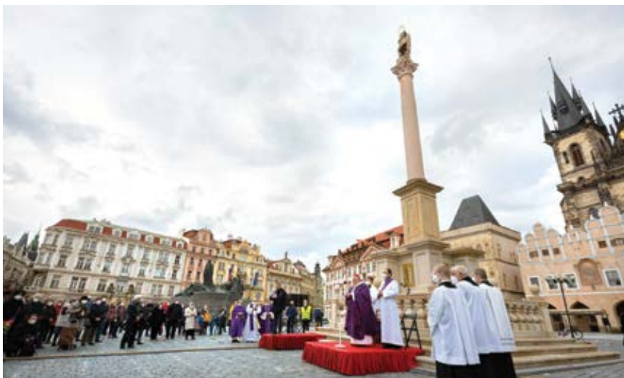
Mši svatou za nenarozené děti, jejich rodiče a za zdravotnický personál sloužil v sobotu 27. března 2021 u Mariánského sloupu na Staroměstském náměstí v Praze kardinál Dominik Duka.

V ještě tiskárnou vonící Vatikánské ročence se dočteme docela dobré zprávy: „Na konci roku 2019 byla v katolických matrikách zapsána jedna miliarda a 345 milionů pokřtěných, což v porovnání s předchozím rokem znamená šestnáctimilionový vzestup. V Evropě ovšem počet katolíků podstatně poklesl (z 21,5 na 21,2%), zatímco v Africe jejich počet vzrostl o 3,4%, tedy více než počet obyvatelstva (2,7%). Ke katolické víře se hlásí 18,7% Afričanů, kdežto v roce 2018 to bylo jenom 18,3%. V Asii a Americe se setkáme s obdobným jevem: také zde počet katolíků stoupá rychleji než počet obyvatel. V Oceánii se naopak přírůstek katolíků i obyvatel pohybuje na téže úrovni (1,1%).“ Nepřekvapivě, ale smutně zní pasáže o povoláních ke kněžství: „V církvi slouží méně