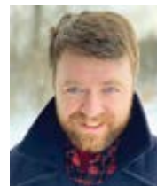
Peter Jesserer Smith píše pro National Catholic Register

Peter Jesserer Smith National Catholic Register Přeložila Alena Švecová