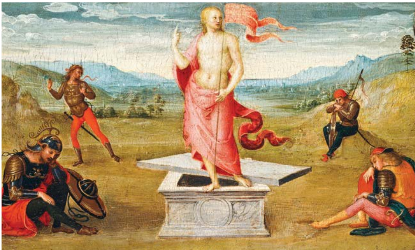
Pietro Perugino: Vzkříšení Krista (1502–1506)