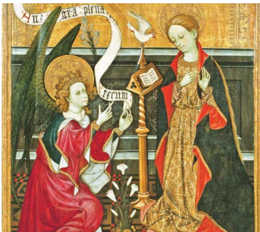
Zvěstování (neznámý autor, cca 1410–1430)

Ve všech těžkých chvílích nám může být povzbuzením a posílením život Svaté rodiny. Maria početí Božího Syna Ježíše Krista neplánovala, bylo jí oznámeno. Hrozilo jí nejen společenské odsouzení, ale dokonce i ukamenování. Nevěděla, kde bude rodit, ani jak zabezpečí své dítě. Svatý Josef jí byl však ve všech situacích oporou. Pro každého muže tak může být vzorem, aby statečně [Srov. papež František, apoštolský list Patris corde (8. pro-