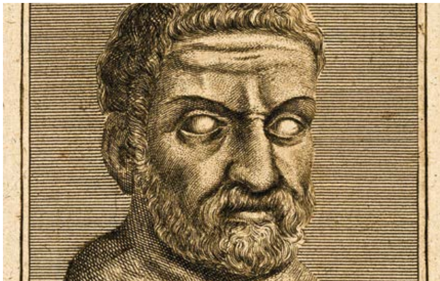
Thalés z Milétu

Thalés však nepřišel se svým novým učením jen tak z plezíru. Skrýval se za