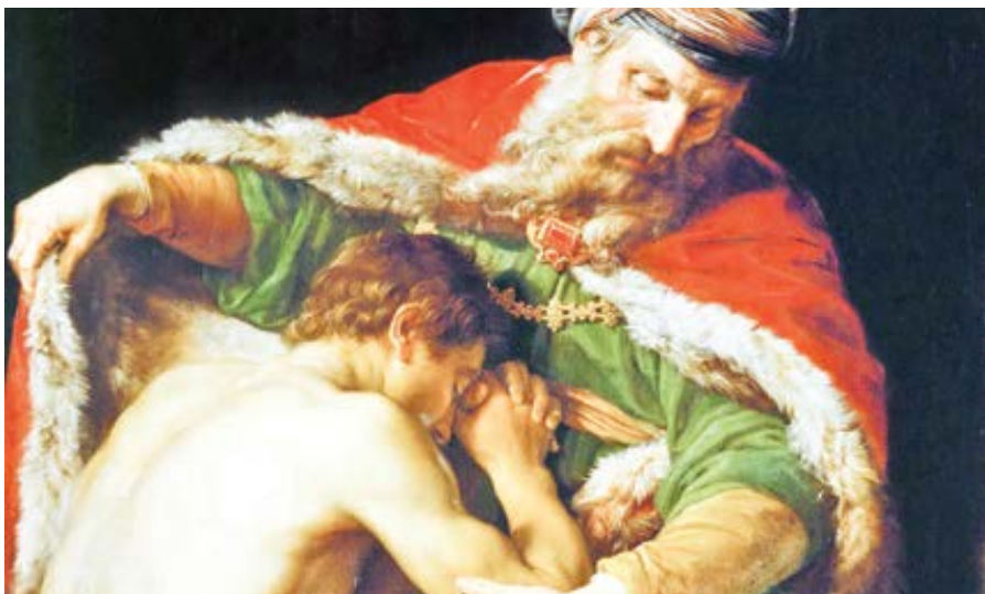
Pompeo Batoni: Návrat marnotratného syna (1773)

Ježíš, který utrpení nikdy nebagatelizoval, ale říkal o něm, že nás v Boží čas vykoupí. Vskrytu mám pocit, že jsem v tomto životě udělal dost dobrého, abych mohl být zproštěn pozemského pokání za dřívější hříchy. Vaši čtenáři nepochybně zareagují, a správně, že tento výrok ukazuje, jak daleko musím ujít. Nejlepší radou, kterou mohu jiným v mé situaci dát, je: Zkoumejte svou pýchu, ne svoje výsady. Strašně často se do cesty k přijetí Krista staví samolibost, ješitnost a sebeuspokojení. Učte se ji podchytit dřív, než zapustí kořeny, a těžké věci najednou přestanou vypadat tak obtížně.