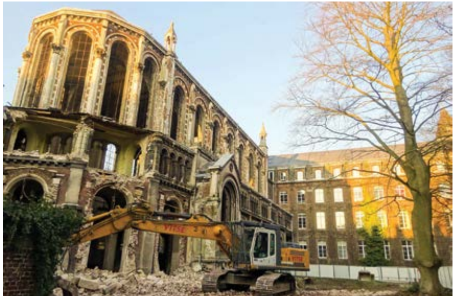
Kaple Sv. Josefa v Lille byla zdemolována.

Zakrývají nám skutečnou nynější krizi. Ať už na videa s tím, jak jsou francouzské kaple srovnávány se zemí, reagujeme jakkoli, problém, co dělat s prázdnými kostely, v dohledné době nezmizí ani u těch v dalších zemích západní Evropy. V posledních letech se sice objevují známky toho, že nezadržitelný pokles návštěvnosti křesťanských bohoslužeb možná zpomaluje, ale věková pyramida těch, kdo chodí do kostela, je poněkud nevyvážená. Do poloviny tohoto století značná část pravidelných účastníků nedělních bohoslužeb zemře a – nedojde-li k určitému probuzení, jaké v Evropě pro-