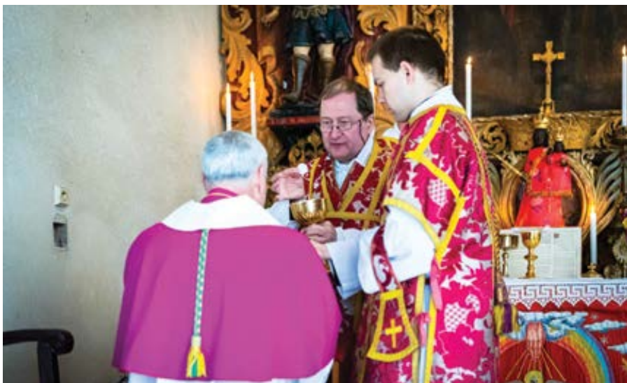
Mariánské poutní místo Řím.

tentické minulosti, Západ musí vytvořit a přijmout liturgii „obnovenou“. Vůbec se nepočítá s tím, že by také „římskokatolíci“ již svoji liturgii milovali, ba ani není stanoveno jako cíl, že by ji měli začít milovat alespoň po změnách, které je údajně nutno provést.