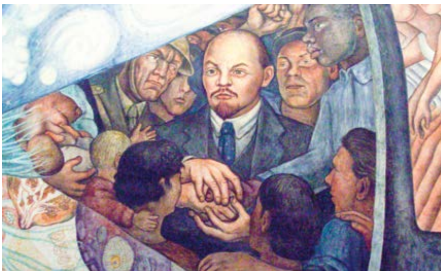
Detail Lenina na fresce „Muž na křižovatce“ (1934) od Diega Rivery, Palác výtvarných umění v Mexico City

Ukázalo se, že chtějí ještě víc. Za prvé