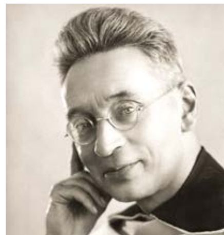
Titus Brandsma, nizozemský karmelitán, cca v roce 1920

Podmínky v Dachau byly horší než mizerné a zdravotní stav jedenašedesátiletého karmelitána se rychle zhoršoval. V červenci 1942 byl umístěn do táborové „nemocnice“, kde byl podroben „lékařským pokusům“ a 26. července byl zabit smrtící injekcí. S vědomím, že má být popraven, se modlil, aby se Bůh nakonec dotkl svědomí zdravotní sestry (příslušnice SS), která vykonávala funkci ošetřovatelky–popravčí – a daroval jí svůj karmelitánský růženec, ačkoli ona protestovala, že je „zbloudilá katolička“. Podle brožury, kterou jsem si vyzvedl v karmelitánském kostele S. Maria v Traspontině nedaleko Vatikánu, se táž zdravotní sestra o několik let později vydala do karmelitánského klášteře, aby