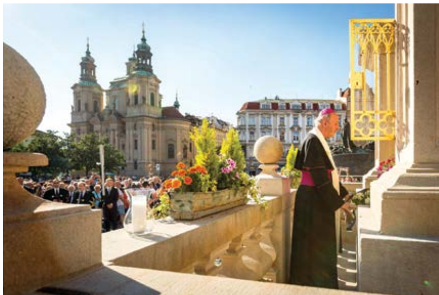
V den své intronizace, navečer 2. července 2022, se pomodlil nový pražský arcibiskup Jan Graubner u Mariánském sloupu na Staroměstském náměstí spolu s věřícími u obrazu Panny Marie Rynecké.

Víme, že doba je náročná. Nevím, jak je to u vás, ale kolem mne se zdá, že se vše mírně řečeno komplikuje, je tolik bolestí a svárů, tolik lidských zranění a tolik ran. Začalo léto, ale běh života mnohých je opravdu zahalen podzimní mlhou, někdy dokonce též krupobitím. Pán neslibuje nebe na zemi, ale s láskou a milosrdným odpuštěním (protože nám bylo odpuštěno!) se toho dá hodně udělat