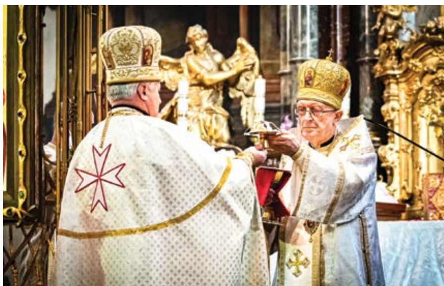
Řeckokatolická katedrála sv. Klimenta v Praze.

Rovněž není pochyb o tom, že východní křesťané milují svoje liturgie také proto, že představují dědictví z pradávných staletí, ještě daleko dávnějších, než těch, z nichž pocházejí klasické biblické překlady církví protestantské reformace. V liturgických textech orientálních obřadů je uloženo nesmírné dogmatické