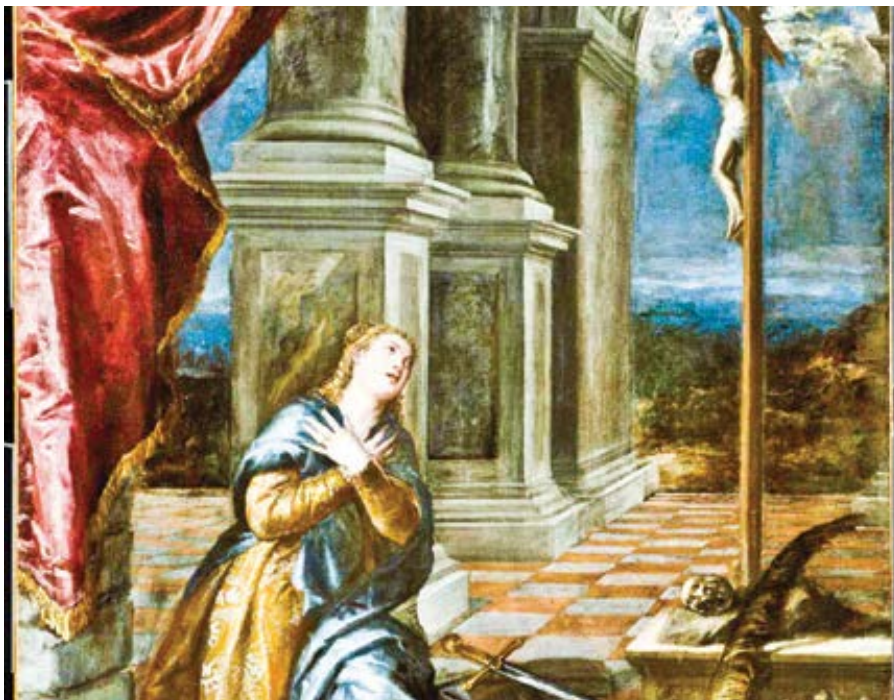
Titian: Svatá Kateřina Alexandrijská v modlitbě (1567)

A také když se někdo z otupělosti oddá žádostivosti a vydá se do rukou svých nepřátel, Bůh mu nepomůže ani ho nevyšlyší, protože se hříchem odcizil Bohu. Proto je třeba odevzdat Bohu vše, na čem člověku záleží, a volat k Bohu, aby mu pomohl. A člověk by neměl volat o Boží pomoc slabě, ani s myšlenkami bloudícími sem a tam, protože takový člověk nejenže nedostane to, o co prosí, ale ještě více dráždí Pána. Jestliže totiž někdo stojí před vladařem a hledí svým vnitřním i vnějším zrakem, aby snad nebyl potrestán, čím spíše by měl stát pozorně a s třesením před Bohem? Pokud se však oslabení hříchem nedokážete soustředěně modlit, jděte vpřed, jak nejlépe umíte, stůjte před Bohem, směřujte svou mysl k Němu a Bůh vám odpustí, protože to není z nedbalosti, ale z křehkosti, že nemůžete stát před Bohem, jak byste měli. Pokud se takto donutíte, nepřestávejte, dokud nedostanete. A když se modlíš a nedostaneš, je to proto, že jsi prosil špatně, buď bez víry, nebo lehkomyšlně, nebo o něco, co se ti nelíbí, nebo jsi přestal. Někteří však velmi často namítají: proč se modlit? Copak Bůh neví, co potřebujeme? On ví a hojně nám dává všechny duchovní dary ještě dříve, než o ně požádáme. O ctnostné chování a nebeské království je však třeba nejprve prosit a usilovat o ně a s vírou a trpělivostí přinášet vše, na čem nám záleží, pokud nám naše vlastní svědomí nebude vyčítat nějaké pohoršení.