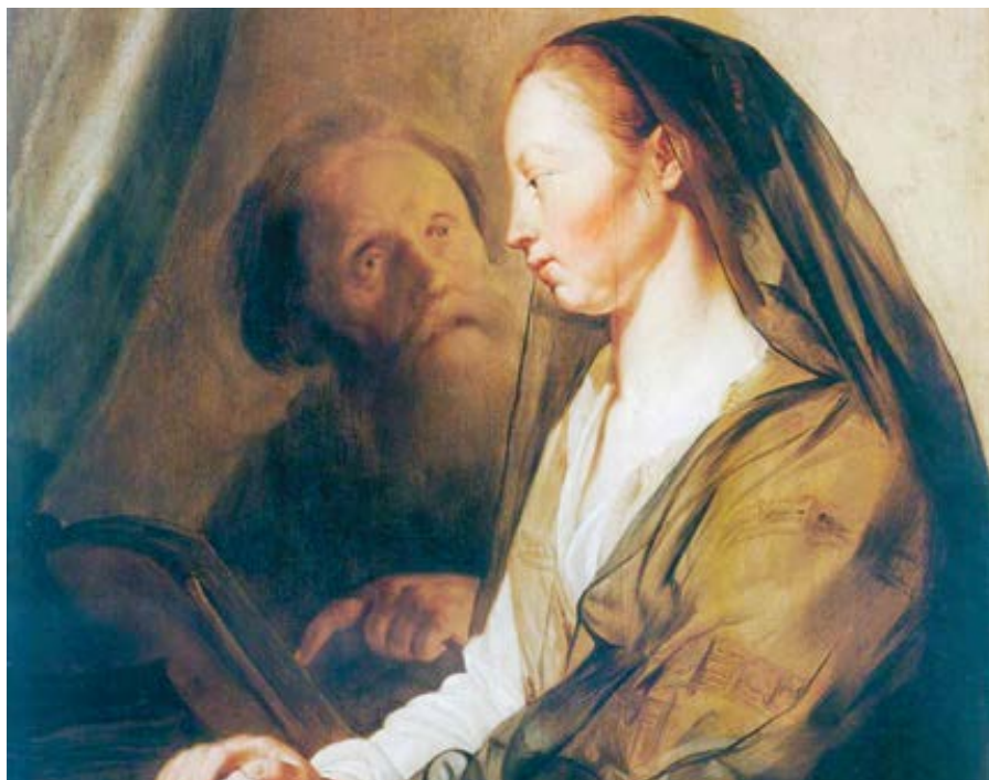
Pieter de Grebber: Podobenství o nespravedlivém soudci a vdově (1628)

Tato vdova se může podobat církvi, která se zdá být opuštěná, dokud nepřijde Pán,