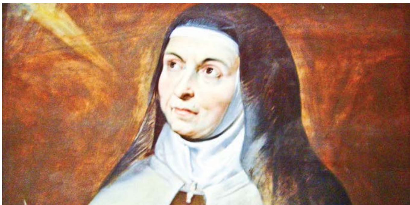
Peter Paul Rubens: Sv. Terezie z Avily (1615)