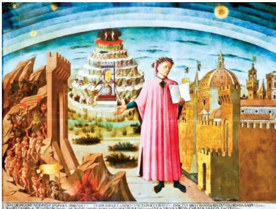
Domenico di Michelino: Dante a jeho báseň (1465)

Tu umlkne. A snaží se zas vplout do víru tance v onom tratolišti světla, z něhož mne přešla vyslechnout.