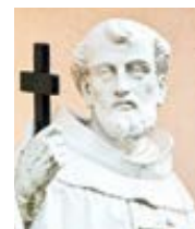
P. Cajetan Mary da Bergamo TAN Direction Přeložila Alena Švecová

Přijměme apoštolské napomenutí a neobviňujme druhé z pýchy, když nám působí nepříjemnosti, ale raději obviňujme sami sebe, že tyto nepříjemnosti neumíme snášet s pokorou. Začneme tím, že si sami osvojíme tu trpělivou pokoru, kterou bychom tak rádi viděli u druhých, a pamätujme na to, že spasení nebudeme skrze trpělivost a pokoru druhých, nýbrž skrze svou vlastní.