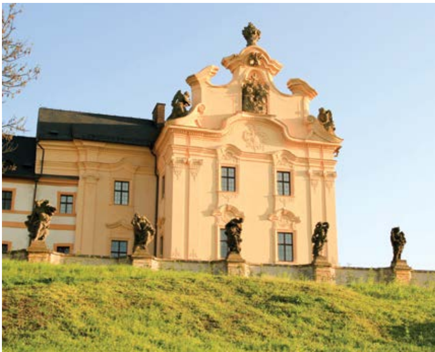
Hospitál Kuks a sochy neřestí.

Agentura AP měla zjevně co na práci. Informovala o pravoslavných věřících, kteří oslavili letošní Vánoce. O obřadech, smyslu symbolů, kráse liturgie nebo modliteb samotných, o víře, ba co více, ani o Vánocích nepadlo ve zprávě ani slovo. Ale víme, že „pravoslavní křesťané v Rusku, Srbsku a dalších zemích slavili letos Vánoce s omezeními, ale zdá se,