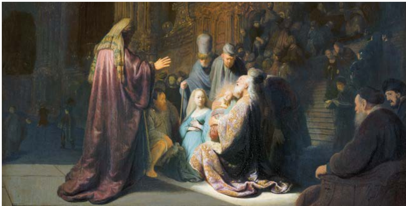
Rembrandt van Rijn: Simeon v chrámu (1631)