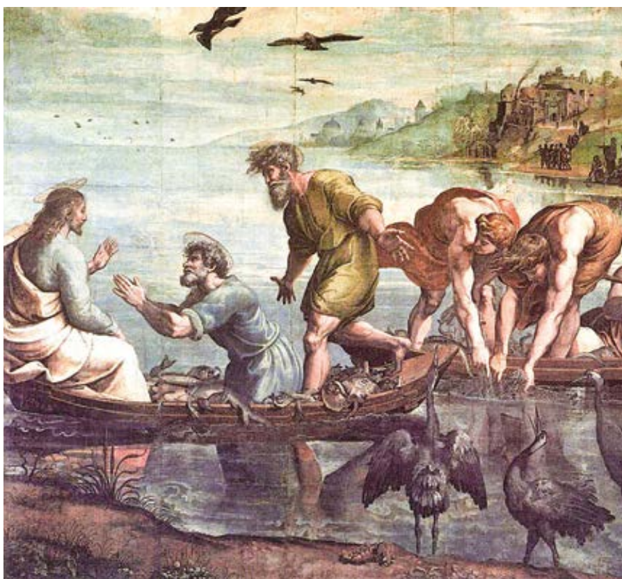
Raphael: Zázračný rybolov (1515)

A skutečnost, že sítě se pro množství ryb trhaly a loďky byly naplněné, až se takřka potápěly, znamená, že v Církvi bude takové velké množství tělesných