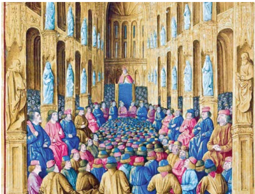
Jean Colombe: Clermontský koncil (cca 1474)

Grosseteste však nepředstavuje jediný historický příklad takového postoje k papežskému úřadu. Sv. Dunstan, slavný arcibiskup canterburský z 10. století, jednou exkomunikoval šlechtice, který pak šel do Říma, aby jeho exkomunikace byla zrušena, a nejspíš pomocí úplatku toho opravdu dosáhl. Když se tento šlechtic vrátil do Anglie, sv. Dunstan papežovo zrušení exkomunikace prostě ignoroval