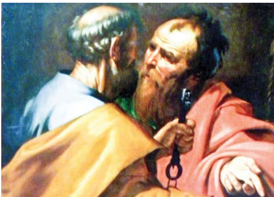
José de Ribera: Svati Petr a Pavel (cca 1612)

Když jsme si tedy jakž takž vyjasnili, co je míněno pod označením „uznávej, cti a můžeš i neposlechnout“, vyvstává jedna důležitější otázka: Je legitimní, aby katolík zaujímal takový postoj? Vždyť jedním ze základních principů katolictví je právě papežství; jak tedy může být „neposlechnout“ věrné člověku, kterého uznáváme jako nositele tohoto úřadu?