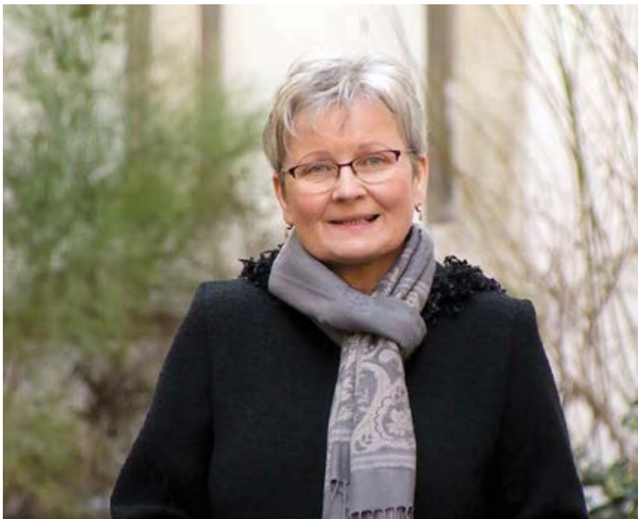
Jana Sieberová.

Pokud člověk nemá víru, že život pokračuje po smrti, cítí se osamocený, bezmocný, zoufalý. Naši nemocní jsou