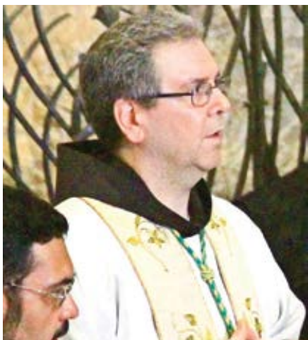
Francesco Patton.

Audience u Svatého otce nás povzbudila a nasměrovala, říká otec Francesco Patton. Navzdory složitému blízkovýchodnímu kontextu příklady žitého bratrství nechybí, dodává v rozhovoru pro Vatikánská média františkánský kustod Svaté země.