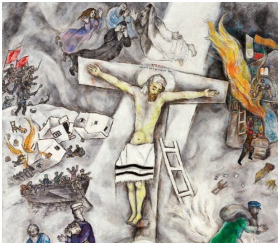
Marc Chagall: Bílé ukřižování (1938)

Hitler se stal z kancléře Vůdcem. Roku 1933 byl otevřen koncentrační tábor Dachau. Byl určen zejména pro politické vězně, ale další tábory brzy následo-