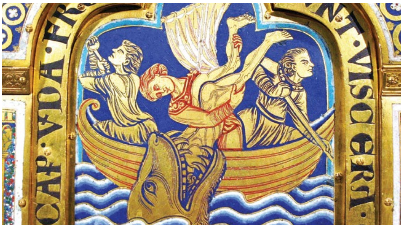
Nicolas de Verdun: Jonáš ve velrybě. Z oltáře v rakouském augustiniánském klášteře Klosterneuburg (cca 1181)