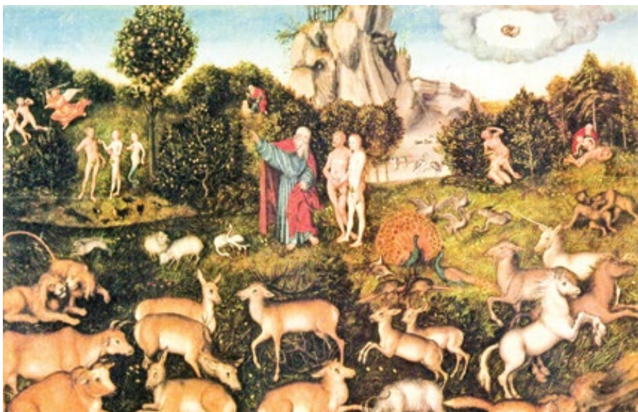
Lucas Cranach starší: Zahrada v Edenu (1530)

To neznamená, že je zcela bezdůvodné obávat se pragmatických problémů, které s sebou nese rychlý růst populace. I papež svatý Jan Pavel II. v encyklice Evangelium vitae uznal, že v některých chudších zemích „existuje většinou vzestup porodnosti a takový přírůstek populace, který ještě ztěžuje podmínky omezeného ekonomického i sociálního rozvoje nebo i jen pomalého vzrůstu“. Tváří v tvář těmto problémům však, jak poznamenal Svatý otec, musí tvůrčí politici usilovně pracovat na zavádění „společných plánů a programů, zabývajících se jednak seriózní ro-