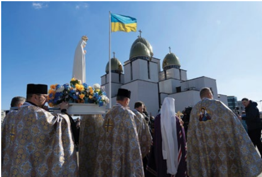
Kopie zázračné sochy Panny Marie Fatimské ve Lvově, kam dorazila 17. března 2022 z Portugalska. V kostele Narození Panny Marie zůstane do 15. dubna.

Zpátky ke Svatému Otci – na slavnost sv. Josefa byla zveřejněna nová apoštolská konstituce o římské kúrii a její službě Církvi a světu. Mnohá média po celém světě zprávu otitulkovala slovy jako „revoluce v církvi“, „papež uvádí do vatikánských funkcí ženy“, „konečně reforma“, „laikům bude patřit řízení církve“ apod. Ale nic se neří tak horké, jak se to uvaří. Preambule konstituce připomíná, že každý křesťan je učedníkem misionářem a že každý může být jmenován do kuriálních řídicích funkcí na základě zastupitelské