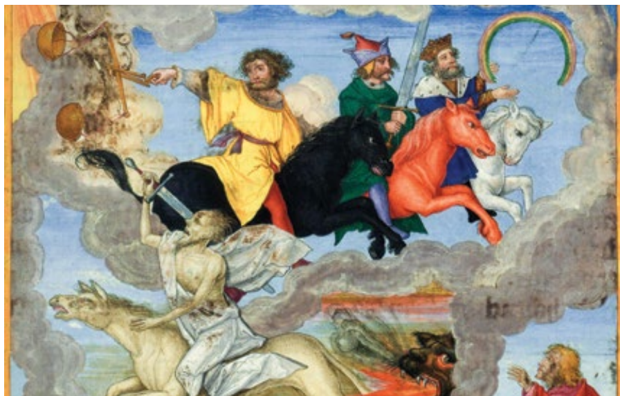
Matthias Gerung: Čtyři jezdci z Apokalypsy (cca 1530–1532)