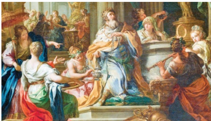
Sebastiano Conca: Šalomunova modloslužba (cca 1750)

Je zajímavé si všimnout, jak se tato touha padlých andělů „vyrovnat se Nejvyššímu“ odráží zde na zemi v mnoha hříších či strukturách zla, které se jistě neuskutečňují bez vlivu „knížete toho-