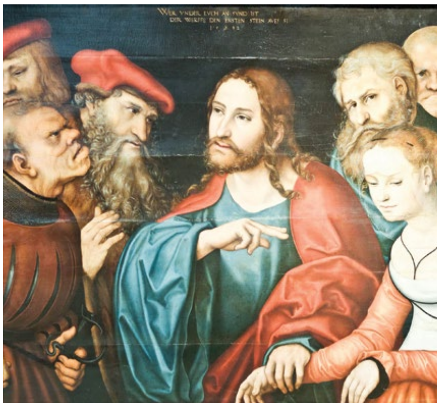
Lucas Cranach starší: Kristus a cizoložnice (1532)

Probodl je kopím spravedlnosti. Kvůli své dobrotě se však nedíval, jak padají, ale odvrátil od nich zrak; proto následoval a znovu se sklonil a psal na zem. Zbývaly tedy dvě věci: bída a milosrdenství, neboť za nimi šel sám Ježíš a žena stála uprostřed. Tato vyděšená žena pravděpodobně doufala, že ji potrestá ten, u něhož nenašla žádný hřích. On však, jakmile zahnal své protivníky spravedlivým slovem, pozvedl k ní své laskavé oči a zeptal se jí; následovalo 10 Ježíš se napřímil