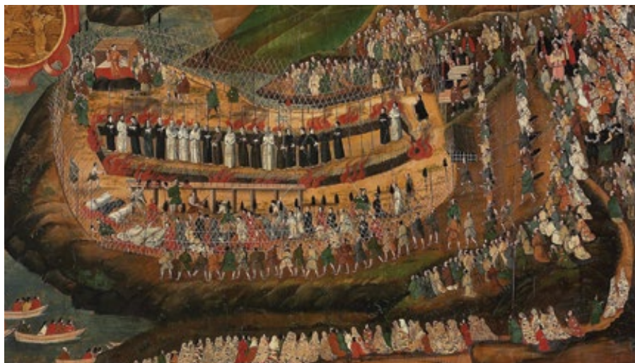
Mučedníci z Nagasaki (1622)

samurajové, odevzdali své meče, dlouhou katanu a kratší wakizaši, aby je předali Shuurimu, a slíbili, že ostatní své zbraně a kopí dodají zítra. Pro samuraje bylo vrcholem pokory vzdát se svých mečů.