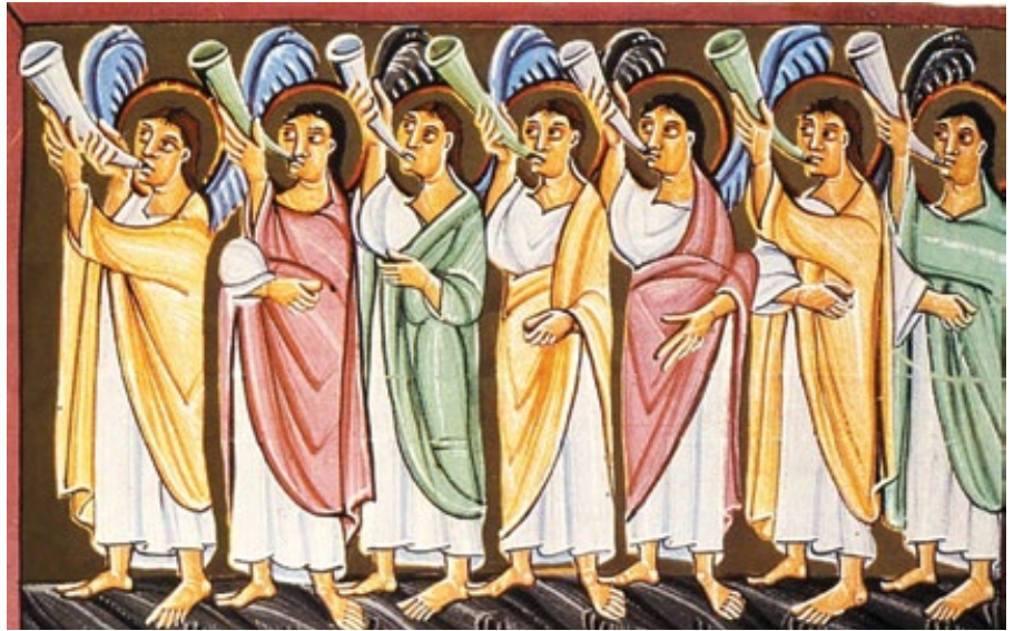
Seven trumpets from the Bamberg Apocalypse – manuscript, created in a monastery on the island of Reichenau around 1000

Neměli bychom být posedlí nebo propadat groteskním zvěstem o tom, že se blíží