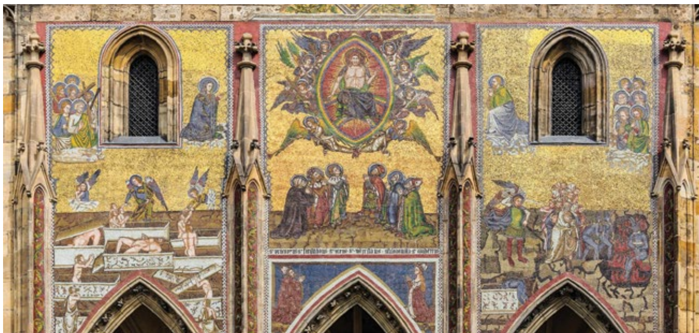
Poslední soud: uprostřed Kristus—soudce, vlevo spasení, vpravo zatracení. Mozaika Zlaté brány pražské katedrály.