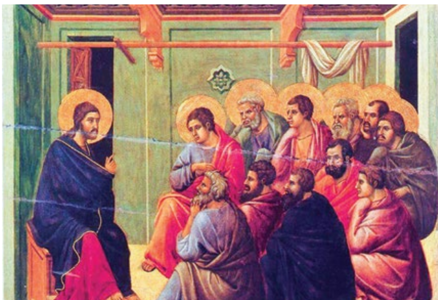
Duccio di Buoninsegna: Kristus se loučí s apoštoly (1308–1311)

Nebo jinak. „Sláva“ zde není chápána jako chvála velkého množství lidí, jak ji definují někteří pohané. To je zřejmě něco jiného, než co se říká v Exodu, že stánek byl naplněn Boží slávou (srov. Ex 40,34) a že Mojžíšova tvář byla oslavena. V doslovném smyslu měl svatostánek jakousi božstější podobu a stejně tak Mojžíšova tvář, když mluvil s Bohem. V analogickém smyslu se Boží sláva nazývá zjevením. Rozum je zbožštěn a přesahuje všechny hmotné věci, takže v tom, na co se dívá, vidí Boha. V přeneseném smyslu znamená výrok „Mojžíšova tvář byla oslavena“, že měl zbožštěný rozum. S Mojžíšovým poznáním se však nedá srovnávat vznešenost Krista, který oslavil tvář své duše. Syn je totiž podle mého názoru celým jassem Boží slávy, jak říká Pavel: on je jassem jeho slávy a obrazem jeho podstaty (Žid 1,3), a z tohoto světla veškeré slávy pak vycházejí jednotlivé odrazy pro celé rozumové stvoření. Po-