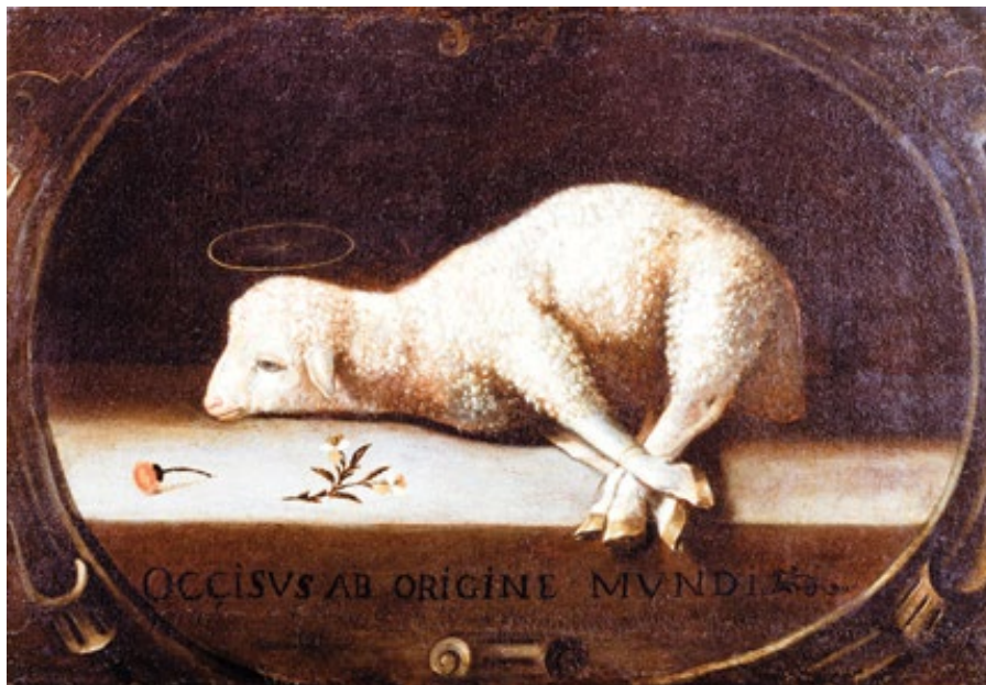
Josefa de Óbidos: Obětní beránek (1670–1684)

Pro dav je obětní beránek zdrojem všech problémů a v zájmu většího dobra je nutno ho zlikvidovat. Téměř všichni v davu tomu věří, a kdo to napadne, je