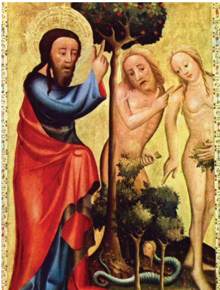
Mistr Bertram: scéna z Grabowského oltáře (1375–1383)

Ale poté, co jsme se vzali, mysleli jsme si – ačkoli jsme oba toužili po dětech –, že bychom měli početí dětí alespoň na pár let odložit. V důsledku rop-