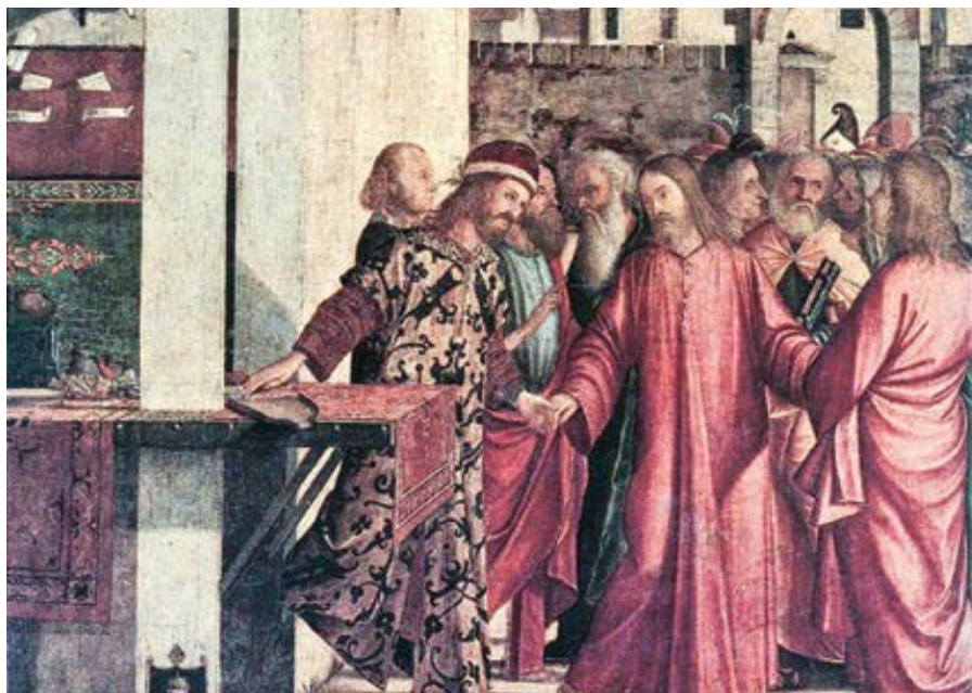
Vittore Carpaccio: Povolání sv. Matouše (1502)

A také bere na lehkou váhu lidské nebez-