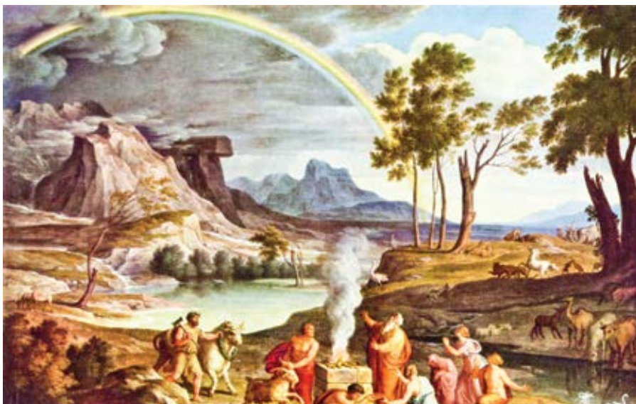
Joseph Anton Koch a Gottlieb Schick: Krajina s Noem, nabízející oběť vděčnosti (1803)

Tento neobvyklý pastýřský list podepsali skandinávští biskupové, konkrétně ze Švédska, Norska, Dánska, Islandu