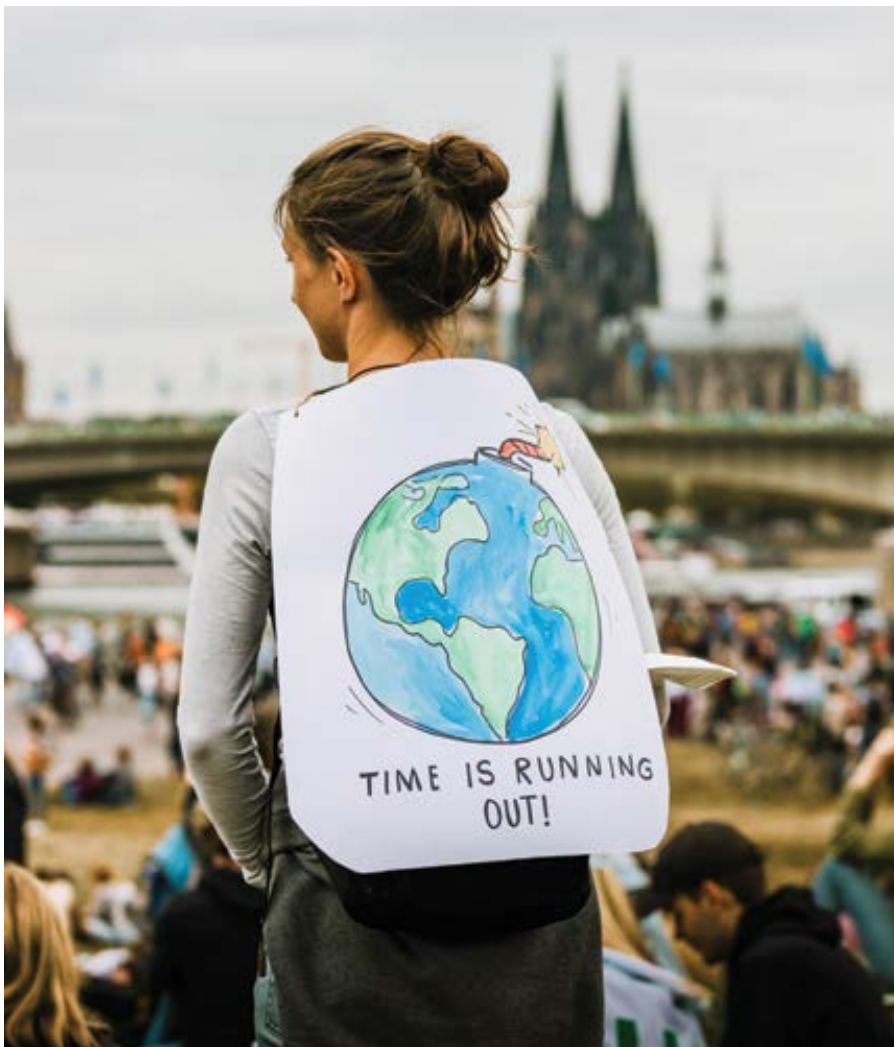
Čas běží, varují zoufale.

Apokalypsa dnes bývá chápána jako smrtelně násilná událost, jako například katastrofální globální oteplení. Tak tomu ale nebylo vždy. Apokalypsa původně znamenala zjevení, prorocství o neznámých věcech či událostech, které se někomu ukázaly ve snech, viděních nebo prostřednictvím andělů. Víra ve zjevení, v soudný den a v následné Boží království je staršího data než Kristovo vtěle-