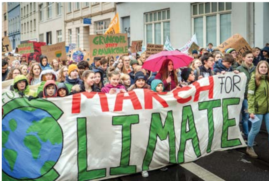
Fridays for Future: Pochod za klima.

výsledek hrdí. “To nejsou slova politického bojovníka. Jsou to slova samozvaného proroka.