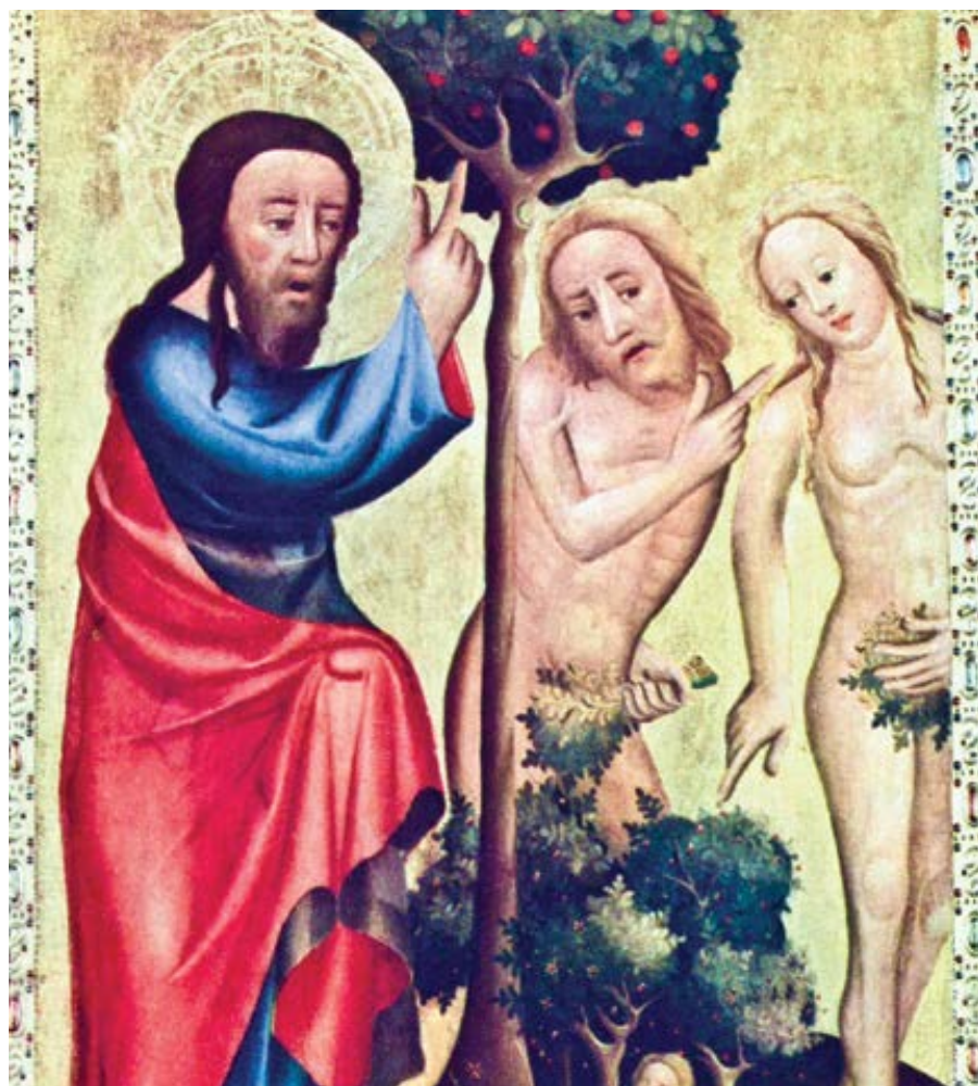
Mistr Bertram: Bůh kárá Adama a Evu (1375–1383)

že na počátku jejich manželství bojoval s alkoholismem. Až ve svých dvaceti letech jsem se dozvěděl, že několik let před mým narozením jí byl také nevěrný. Mnohokrát jsem o tom přemýšlel, protože v našem rodinném stereotypu se neobjevovaly žádné důkazy o této nevěře. A vzal jsem si z toho několik ponaučení: Můj otec měl pokoru a odvahu činit pokání a změnit se a moje matka prokázala milosrdenství a odvahu odpustit mu a přijmout ho zpět. A oba měli dostatek lásky, aby překonali nevyhnutelné zranění, aby tyto rány zahojili a z celého srdce se věnovali svým dětem.