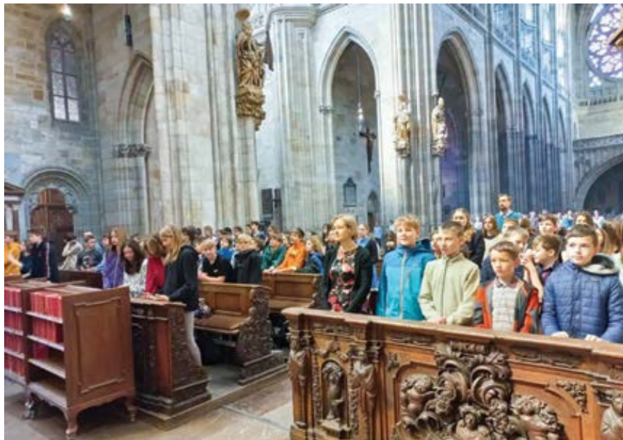
Studenti Křesťanského gymnázia oslavili 30. výročí vzniku školy bohoslužbou v katedrále sv. Víta, Václava a Vojtěcha.