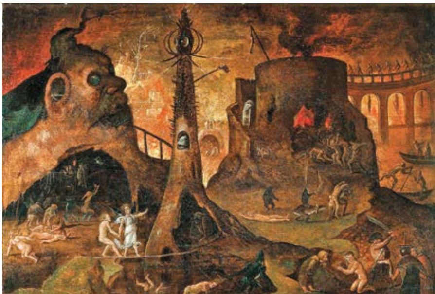
Žák Hieronyma Bosche: Anděl vede duši do pekla (16. st.)

S tím, jak se šířilo křesťanství, se šířily i představy o apokalypse – v Koránu a hadíthu pronikly i do islámu. Velký křesťanský myslitel sv. Augustin (354–430) rozvinul apokalyptické téma, když vypočítal, že konec světa nastane zhruba 300 let po jeho smrti. Biskupové, mniši, mystici a papež pak formulovali další předpovědi. Ve středověku měl Kristův