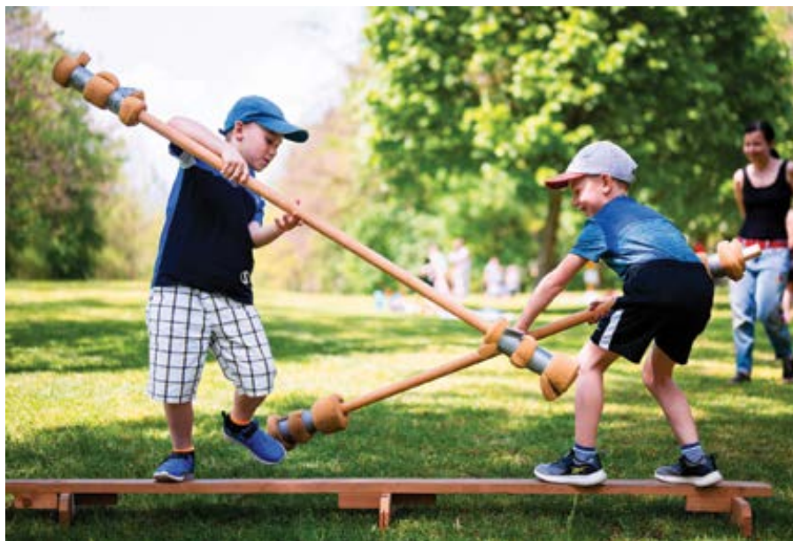
Z Poutě rodin a přátel Vlčího doupěte na Sv. Antoníně.

Upozornění pro souvislosti hledající: nic takového v západní Evropě není normou. Údajně je však záměrem mít neutrální doklad. Dr. Václav Fejt, mikrobiolog a laboratorní imunolog, o tom nedávno jako praktik v medicíně řekl: „Neutrální