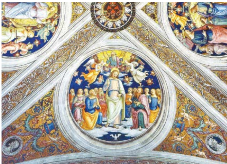
Pietro Perugino: Ježíš s apoštoly (cca 1508)

Nebo když mluví o moudrých, nemluví o pravé moudrosti, ale o té, kterou zřej-