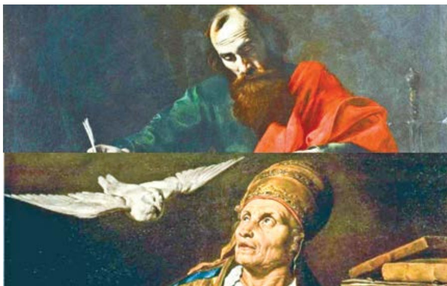
Sv. Pavel a sv. Řehoř.

Když však přišel Petr do Antiochie, přímo jsem proti němu vystoupil, protože si zasloužil výtku. Než totiž přišli jistí lidé z Jakubova okolí, jídal společně s pohanokřesťany. Ale když přišli, začal se stranit a odlučovat, protože měl obavy z oněch židokřesťanů. A s ním se začali tak neupřímně chovat i ostatní židokřesťané, takže dokonce i Barnabáš byl stržen tou jejich