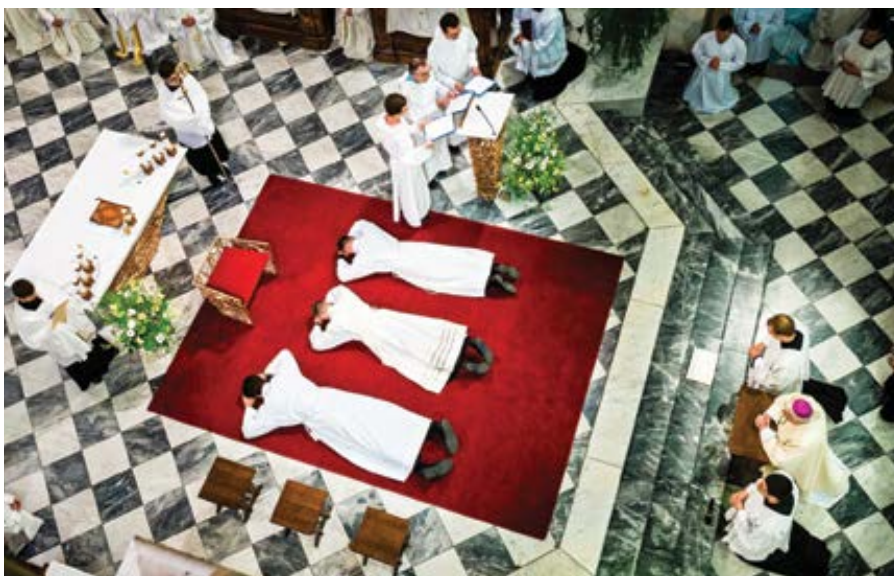
Kněžské a jáhenské svěcení 17. června v brněnské katedrále sv. Petra a Pavla.

Kanál Seznam Zprávy čtu jen z preventivních důvodů, abych znala myšleni nepřítelé, ovšem musím upřímně říci, že se tam potká i dobrý textík. Třeba mám na mysli teď jeden od pana Matouše Hrdiny. Titulek zní nekompromisně: Číst méně encyklopedií, víc beletrie. Jinak nad AI nevítežíme. „Přes nesporné informační kvality má velká část literatury faktu jen velmi průměrnou stylistickou a literární úroveň, je zjevně psaná narychlo, a řada titulů působí jako zby-