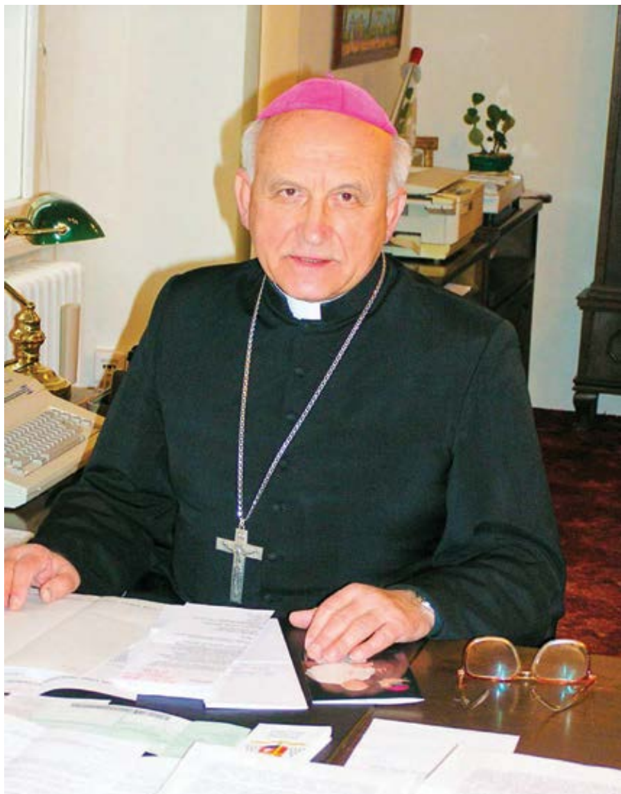
Mons. Alojz Tkáč.

je být každému a vždy bratrem. Má slabost – rychlé vzplanutí, hněv, bezohlednost; nezodpovědnost druhých zapříčiní, že se prohřeším vůči bližním. Vzápětí mne to mrzí, lituji toho, ale už je pozdě.“