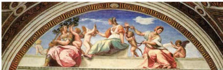
Rafael Santi: Alegorie ctností, freska ve vatikánské Raffaelově síni Stanza della Segnatura (1511)

první? Chtěl bych začít připomenutím prozíravosti. Tato ctnost nás vede k tomu, abychom nacházeli konkrétní prostředky, jak uskutečnit zvolené cíle. Stále více propadáme pokušení odhmotněného křesťanství. Často slyším hlásání „náboženství dobrých úmyslů“. I z nejlepších úmyslů, nepromění-li se v realitu, se však nakonec stanou sny či přeludy.