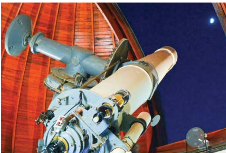
Vizuální refraktorový teleskop Zeiss ve Vatikánské observatoři v Castel Gandolfo.

V 17. století byla pro vědce otázka, zda se Země otáčí, velice důležitá. Mikuláš Koperník tvrdil, že k otáčení dochází. Pro jeho teorii, že Země společně s Venuší, Marsem a dalšími planetami obíhá kolem Slunce, bylo toto otáčení nezbytné.