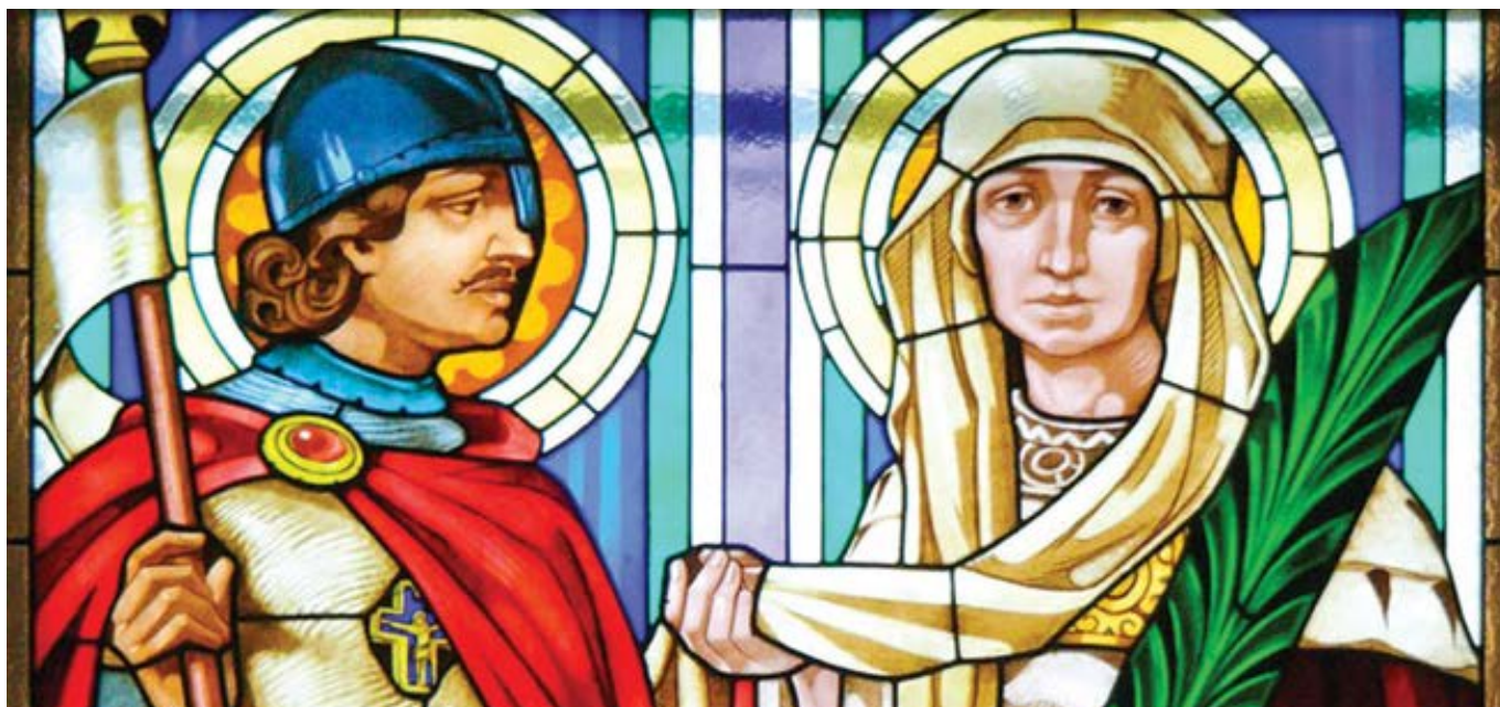
Svatý Václav a Svatá Ludmila v kostele svatého Cyrila a Metoděje v Olomouci.