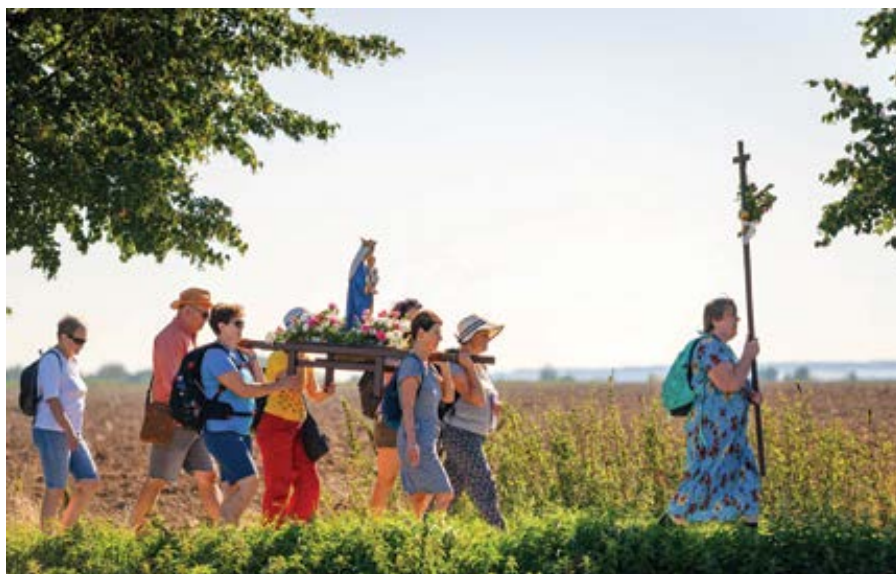
Hlavní pouť do Hájku, září 2023.

Veřejným prostorem otřásá diskuse povrchnější, i když... Je zde snaha omezit rychlost pro osobní automobily v městech ze současných 50 na 30 km/h. Jistě, je legitimní se o tom bavit a debata přináší řadu různých stanovisek. Evropská rada pro bezpečnost v dopravě a Centrum dopravního výzkumu spočítali, že