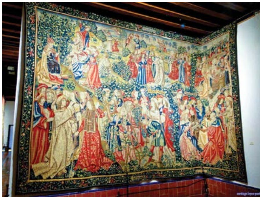
Wlámská škola: Podobenství o dělnících na vinici (tapiserie cca 1500).

Nebo má vinař, neboli náš Stvořitel, vinici, neboli celou církev, která od spravedlivého Ábela až po posledního vyvoleného, který se narodí na konci světa, vyhání tolik ratolestí, kolik spravedlivých lidí zrodila. A Pán nikdy nepřestal posílat dělníky, aby učili jeho lid, to znamená, aby se starali o vinici. Snažil se vinici zušlechťovat prostřednictvím dělníků: nejprve otců, pak učitelů Zákona, potom proroků a nakonec apoštolů. Ačkoli dělníkem na této vinici byl každý, kdo jakýmkoli způsobem nebo v jakémkoliv míře konal dobré skutky s pravou vírou.