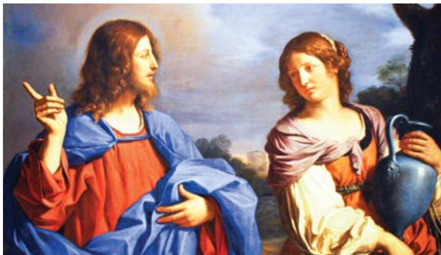
Giovanni Francesco Barbieri: Kristus a Samařanka (cca 1640-1641)

Volání po změně či opuštění požadavků evangelia vykazuje oddělenost či odtrženost nauky od života, dogmatu od zkušenosti, teologie od spirituality. Jedním z velkých darů teologického návratu ke zdrojům (označovaného jako nová teologie) 20. století bylo nové ujiš-