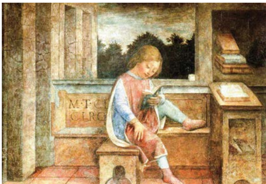
Vincenzo Foppa: Chlapec čte Cicera (cca 1464)

Všechny pozorovatelné vlastnosti v kvantové fyzice lze zachytit pomocí matematických objektů zvaných operátory. A co je důležitější, cokoli, co je operátorem, lze i pozorovat - to je jeden z postulátů kvantové fyziky. Nicméně existují věci, které možná nikdy nebudeme schopni změřit kvůli nedostatku paměťového prostoru, přestože matematicky představují legitimní a pozorovatelné matematické operátory. V tomto smyslu