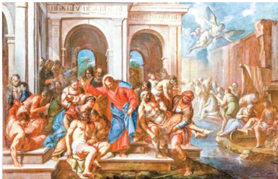
neznámý severoitalský malíř: Ježíš uzdravuje nemocné (17. st.)

byli nevěřící, kteří pro svou nevěru nebyli nijak uzdraveni. Uzdravil tedy mnohé přivedené: ty, kteří měli víru.