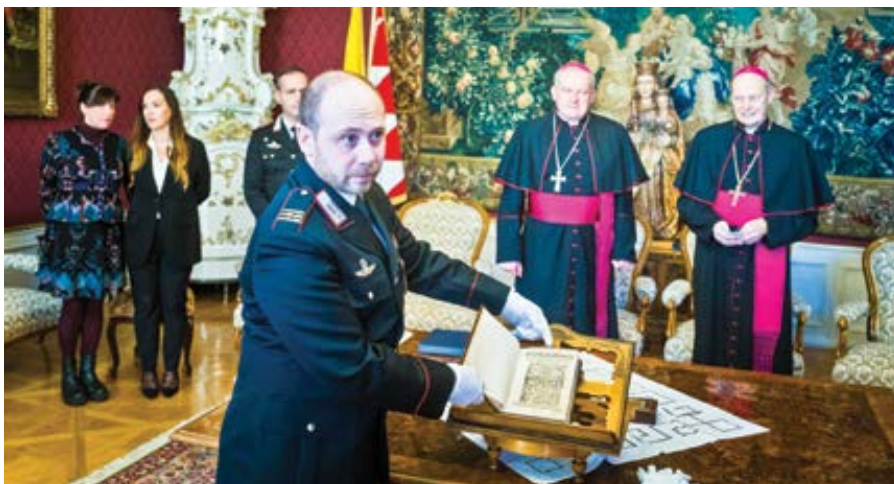
Zástupce italské policie předal do rukou zástupců olomouckého arcibiskupství a metropolitní kapituly cenný výtisk knihy z počátku 16. století Postilla super epistolas et evangelia – svazek z knihovny kapituly, který byl v minulosti odcizen a přednedávnem se ho italské policii podařilo zachytit v severoitalském městě Udine.

krátké, prosté a stručné, ve formě jednoduché modlitby zakončené znamením kříže na každé z obou osob.