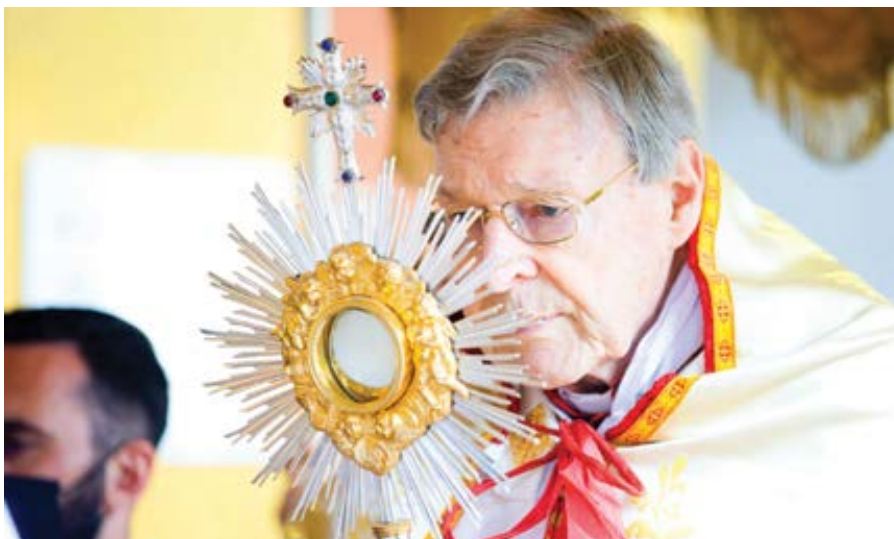
Kardinál George Pell.

který Ten, kdo rozděluje, zasel přímo do srdce Církve?“ ptá se kardinál, a odpovídá: „Papež František řekl: ‚S ďáblem se nediskutuje! Neporazíme ho tím, že s ním budeme debatovat, je v tom lepší než my. Porazíme ho tak, že se mu postavíme s vírou a Božím slovem.‘ V logice této nauky papeže Františka s Rozdělovačem nediskutujeme. Nepouštíme se do diskuse s Fiducia supplicans , nýbrž odpovídáme prostě Slovem Božím, magisteriem a tradiční naukou Církve.“