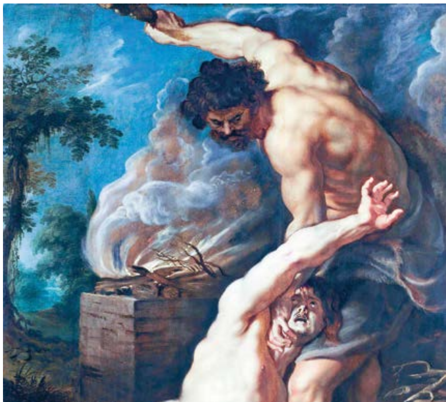
Peter Paul Rubens: Kain zabíjí Ábela (1608–1609)