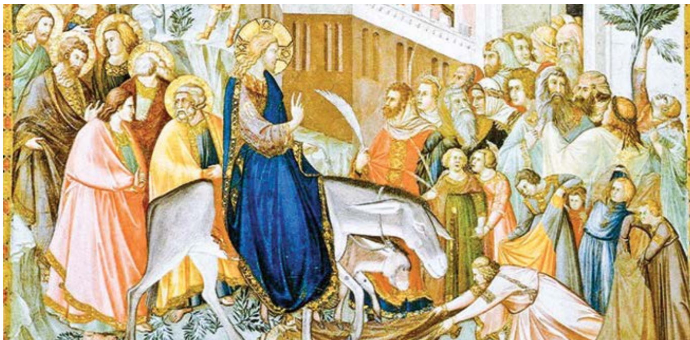
Pietro Lorenzetti: Ježíšův vjezd do Jeruzaléma (14. st.)