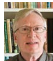
Jeff Mirus Catholic Culture Přeložil Pavel Štíčka

Jak prožíváme jednu postní dobu za druhou, všichni máme sklon ztratit smysl pro naléhavost. I když ho znovu získáme, nemusí nás to vést k dramatickým změnám. Vždy je však dobré si na začátku uvědomit, že tento citát o příhodném čase je mnohem snazší vyslovit než podle něj konat. Je mnohem snazší citovat než žít. Přesto je postní doba časem, v němž jsme znovu povoláni pocítit neúprosnou naléhavost Boží milosti.