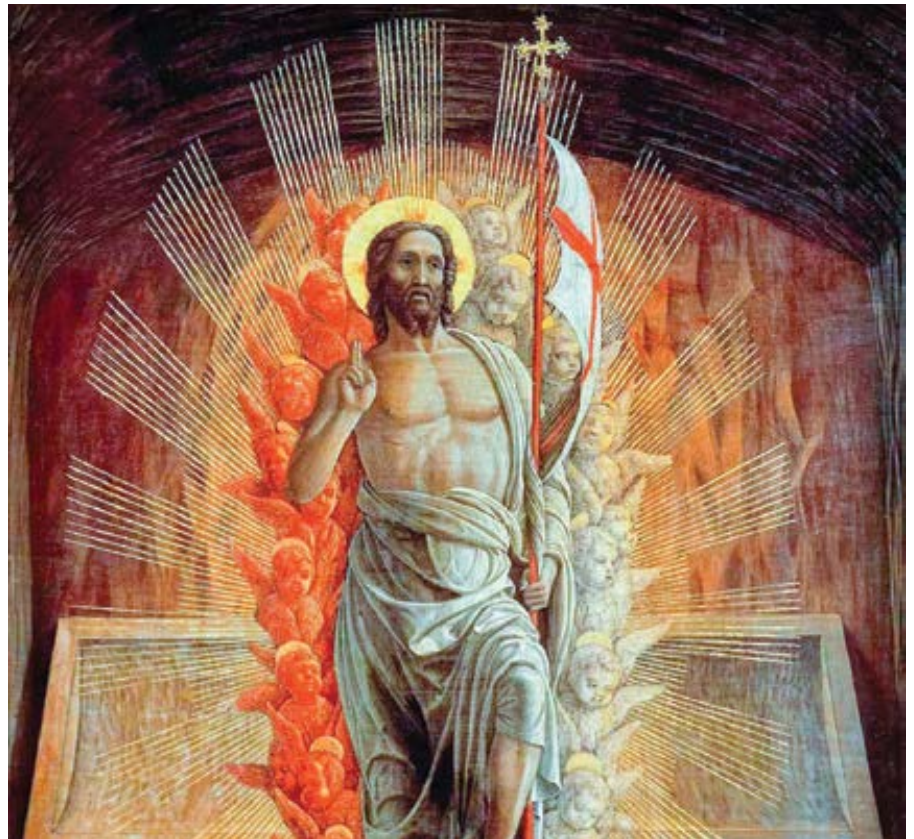
Andrea Mantegna: Vzkříšení (15. st.)

Nemůžeme si myslet, že tak podrobné vyprávění evangelistů neobsahuje žádná tajemství. Mladší Jan označuje