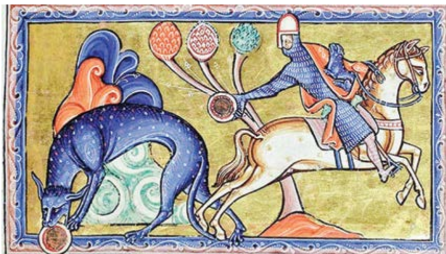
Aberdeenský bestiář. Manuskript z 12. st.

Bůh však stvořil lidi tak, aby milovali, chápali a věděli, které skutky jsou v souladu nebo v rozporu s pravdou, láskou, dobrem, skutečností atd. Stvořil nás tak,