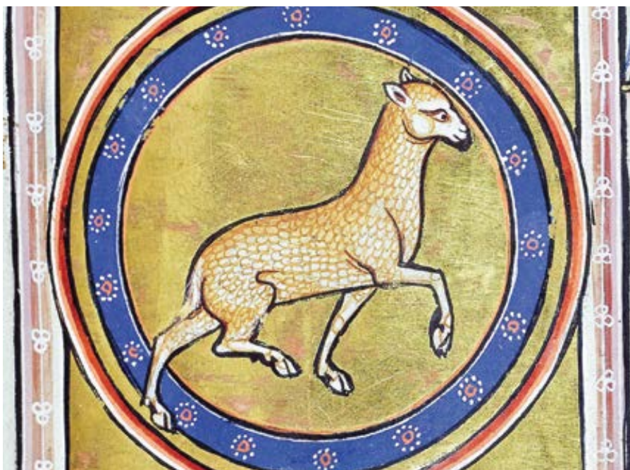
Aberdeenský bestiář. Manuskript z 12. st.

Tyto druhy se smyslovou duší mohou také rozpoznávat a pamatovat si hmotné předměty, ale nemohou pozná-