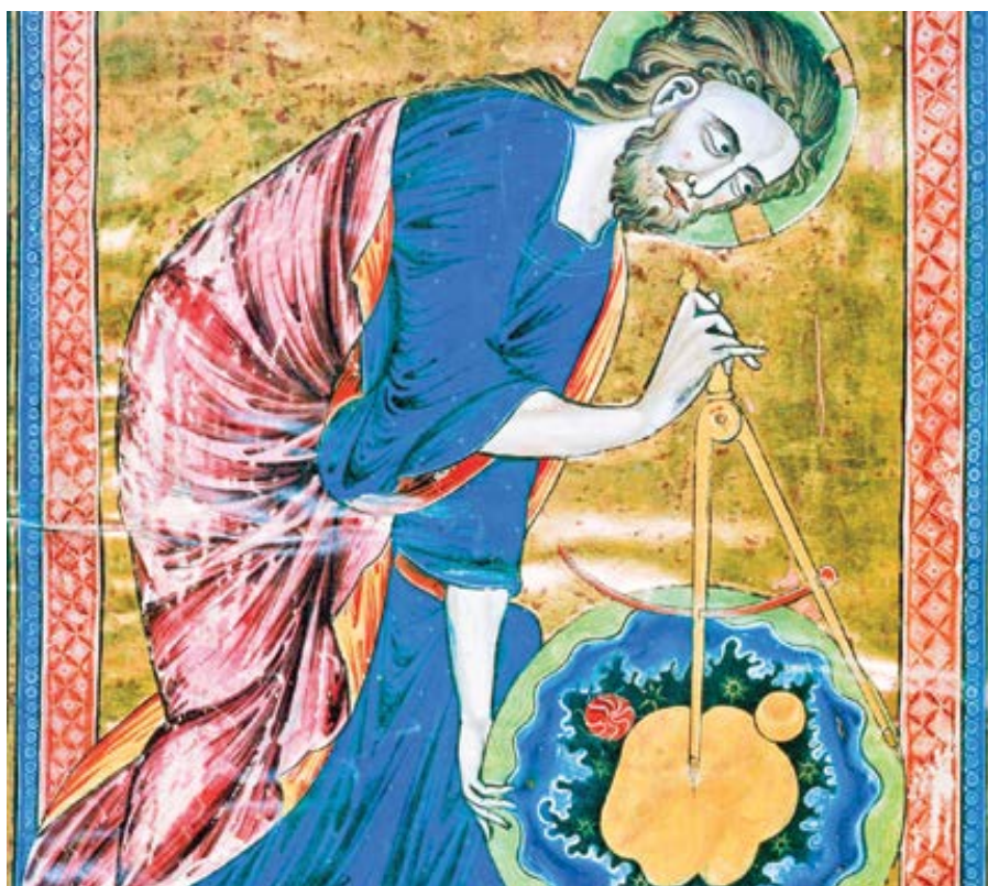
Bůh jako Stvořitel vesmíru (manuskript, cca 1220–1230)

Podle zprávy 10 vydané organizací Family Research Council mezi lety 2018 a 2023 vzrostl ve Spojených státech počet útoků na kostely o 800% 11 . Útoky