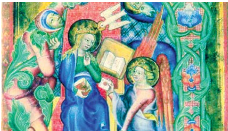
Misál Jana ze Středy: Miniatura Zvěstování s archandělem nesoucím Panně Marii zapečetěný dopis (1360)

Pouze několik posledních desítek let lidské historie, která trvá již nějakých 100–200.000 let, začínáme rozumět genetice, která k předávání života zcela nezbytně patří. Lidský genom měl být přečtený v roce 2003, ale tohoto cíle bylo dosaženo pouze z 92%. Sekvence a přečtení lidské genetické výbavy je výdobytkem uplynulých let (leden 2022). Lidská DNA je úžasná molekulární struktura, která definuje, jak každý člověk vypadá. Tato molekula se tvoří v okamžiku, kdy po spojení spermie s vajíčkem dojde k vytvoření zcela unikátní genetické informace v jádře oplozeného vajíčka, a tato genetická výbava každého z nás provází od našeho početí až do smrti, a to v téměř každé buňce našeho těla, s výjimkou buněk pohlavních, kde je genetická informace „poloviční“. Tento údaj je nesmírně důležitý v argumentaci