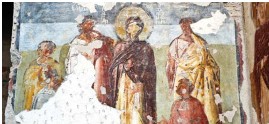
Byzantská freska v římském kostele Santa Maria Antiqua znázorňující umučenou ženu a jejich sedm synů a sv. Eleazara z 2. knihy Makabejské (cca 650)

a nepoužíváme proto, abychom zvýšili svou vlastní schopnost manipulace nebo získali uznání či slávu. Naopak, musí stát ve službě „logu“ – „slova“ či „konceptu“, nikoli našich slov, ale toho, co je skutečná pravda. Mám na mysli samotné Boží Slovo a slova, jak je nejlépe poznáváme prostřednictvím církve, kterou Kristus založil, aby byl přítomen mezi námi.