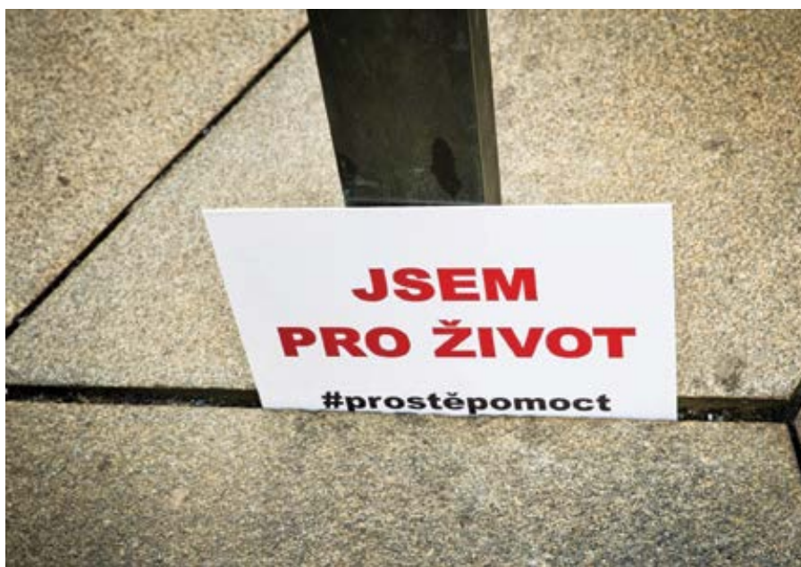
Pochod pro život 2024.

V této sérii se asi doposud nejzevrubněji povedlo zkonstruovat ucelený „narrativ“ o Hnutí Pro život. Na rozdíl od hysterického pana anarchisty, aktivizujícího své úderné jednotky, má autorstvo textů uměřené výrazivo, hladký žurnalistický