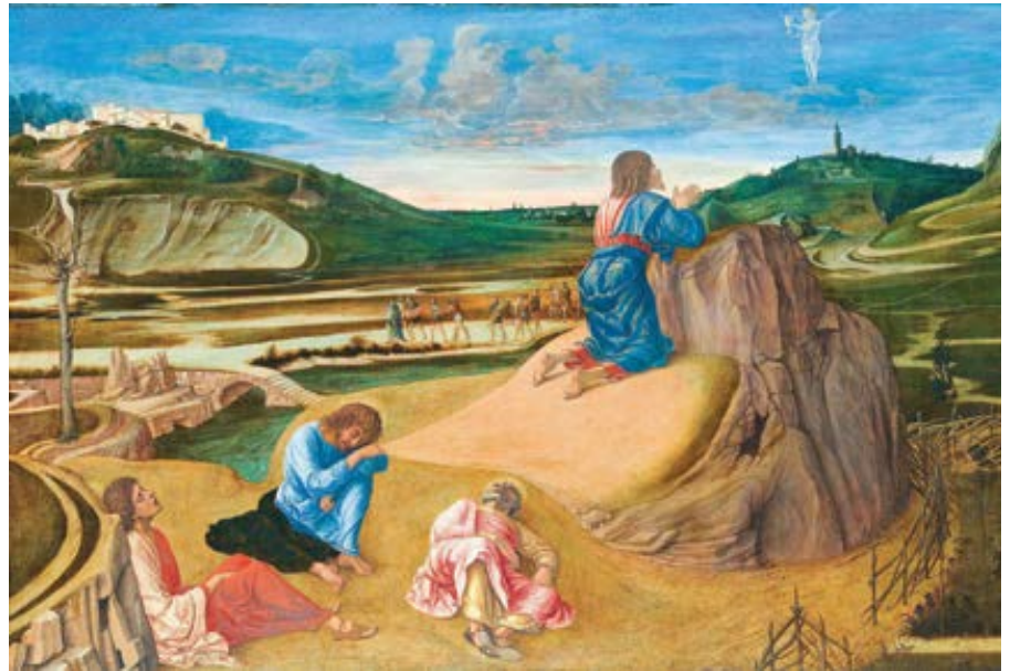
Giovanni Bellini: Agonie v zahradě (15. st.)

Ještě to nezažili v utrpení, které je mělo potkat později, ale podle svého zvyku předpovídá budoucnost slovy v minulém čase. Pak spojuje příčinu, že je svět nenáviděl, protože nebyli ze světa.