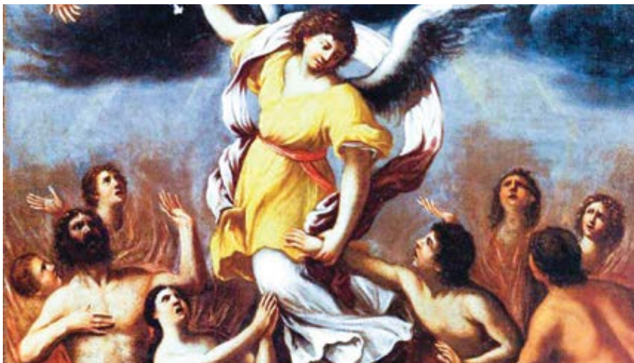
Ludovico Carracci: Anděl vysvobozuje duše z očistce (cca 1610)

Ti, kdo se vážně zabývají apologetikou, používají tři řecké termíny, aby zdůraznili tři klíčové prvky úspěšné obrany víry. Prvním je „ étos “ – tedy „důvěryhodnost“ apologety. Pokud jsou ti, kdo obhajují víru, mrzutí nebo zlomyslní, pokud jsou motivováni osobním prospěchem, pokud neprojevují zájem o blaho svých posluchačů – nebo si libují v laciných řečnických tricích či používají různé druhy nátlaku, aby získali nad posluchači převahu – nebudou působit důvěryhodně a jejich posluchači je pravděpodobně upřímně nevyšly. Z dlouhodobého hlediska musí skutečný obhájce víry projevat důvěryhodnost a zájem, díky nimž budou ostatní ochotni brát ho vážně. Tento