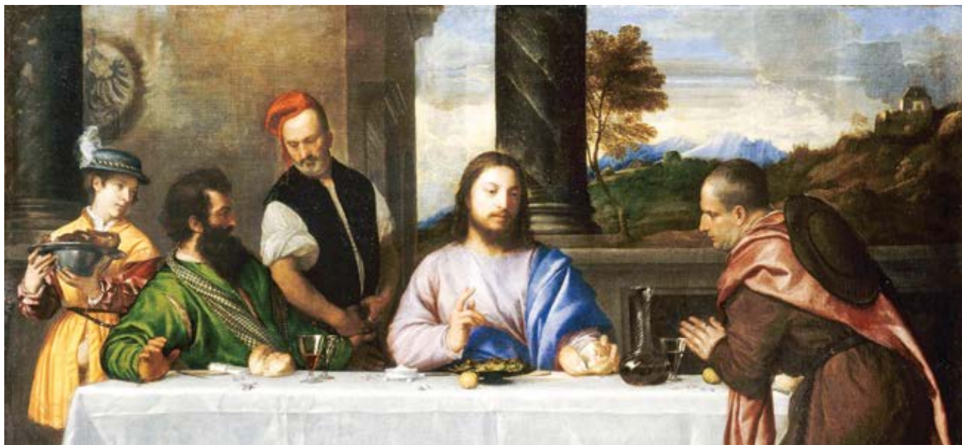
Tizian: Poutníci do Emauz (cca 1535)